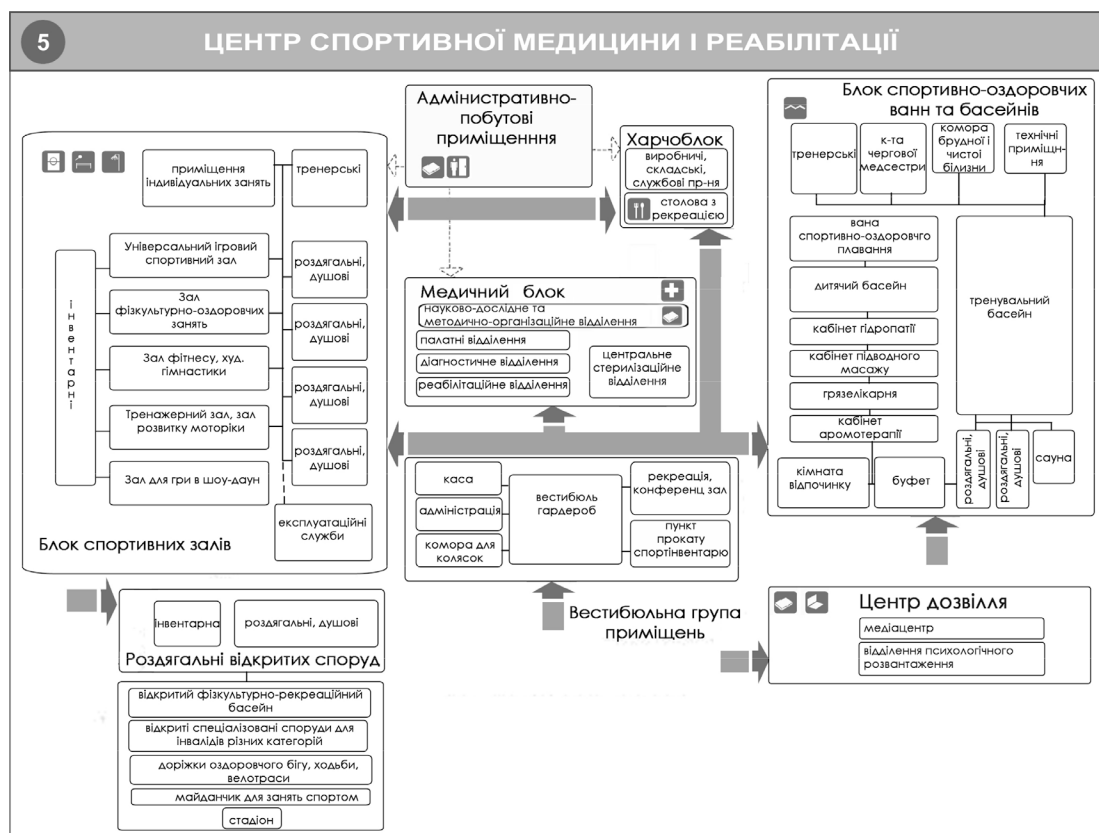
Рис.1. Базова структурно-функціональна модель центру спортивної медицини і реабілітації

Центр спортивної медицини і реабілітації - головна типологічна одиниця запропонованої класифікації та є закладом загальнонаціонального значення, який має розташовуватись в великих містах, де діють головні спортивні споруди країни та зосереджений спортивний потенціал (Київ, Дніпропетровськ, Харків, Одеса, Львів, Донецьк), а також в місцях інтенсивних тренувань (щільна забудова) та в великих рекреаційних зонах міста. Базова структурно-функціональна модель центру СМ і реабілітації (номер 5 у класифікації моделей закладів, див. вище) представлена на Рис.1.