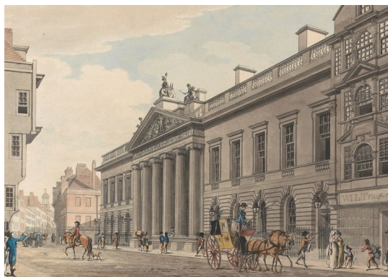
Рис. 1. East India House 1729 р., Великобританія

Для конторських працівників в якості офісу виступали фабрики і заводи а робоче місце стол з табуретом. Не дивно, що перша справжня офісна будівля з'явилась в столиці найбільшої в ті часи держави - Британської імперії. East India House, чотириповерховий палац в Лондоні, з якого адміністративні ниточки йшли в усі британські колонії, населяли сотні службовців. Будівля була побудована до 1729 році і простояло 132 року. Зараз на його місці стоїть приклад офісного комплексу кінця ХХ століття – будівля Ллойдс 1986 року побудови, висотка в стилі хай-тек з вивернутими назовні комунікаціями (Рис. 1.).