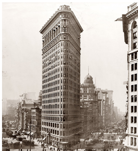
Рис. 3. Flatiron Building, 1904 р.

Почався період будівництва багатоповерхових будівель перших хмарочосів. У Нью-Йорку в 1899 році була побудована тридцятиповерхова будівля, в 1908 році сорока семи поверхова будівля, а в 1913 році - шести десяти поверхова будівля. Це призвело до зростання