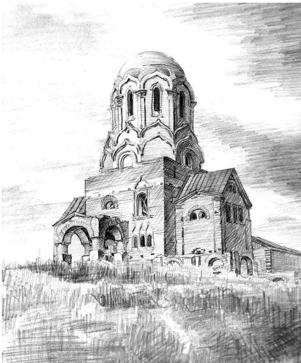
Рис. 2. Недобудований храм пам'ятник в ім'я Святого чудотворця Миколая на Звіринці у Києві. Малюнок В. А. Куцевича. Початок 50-х років ХХ ст.

Зараз будівля храму стоїть у глибині території Інституту проблем міцності НАН України і використовується як його лабораторія. Будівля храму добре проглядається у панорамах Печерська та Звіринця.