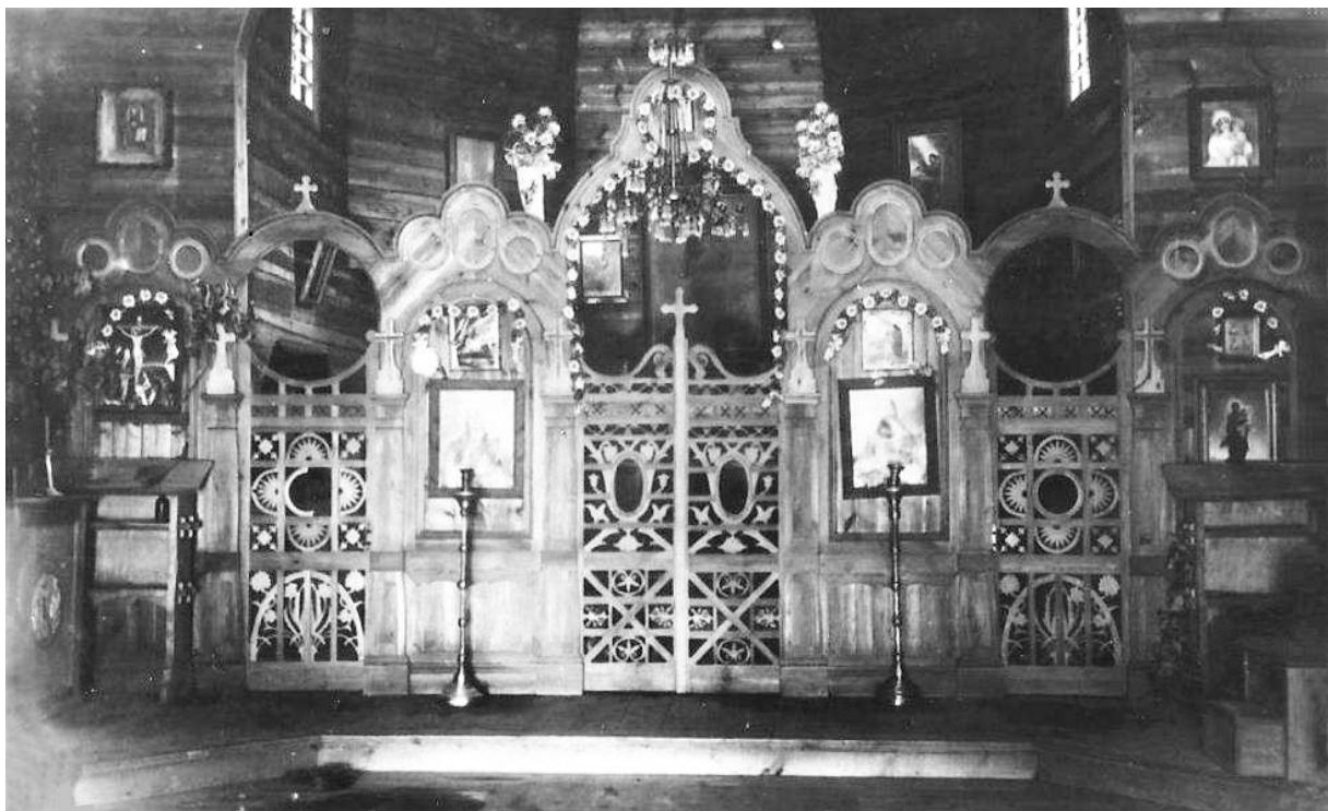
Рис.5. Іконостас дерев'яної греко-католицької церкви у Києві