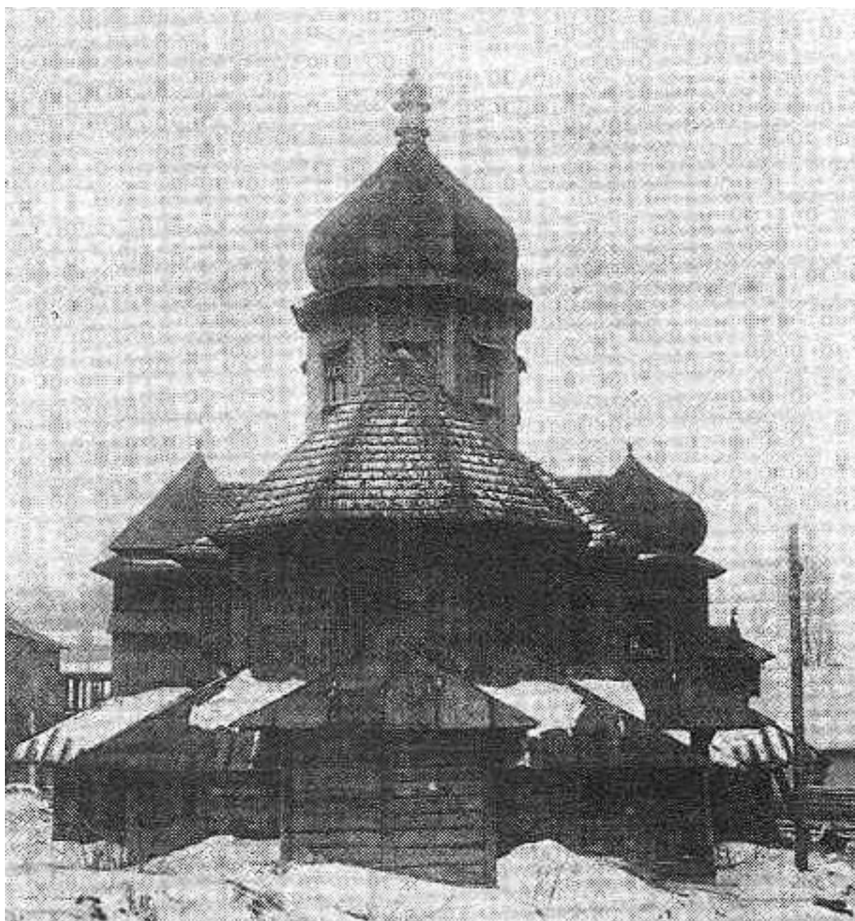
Рис. 3. Дерев'яна греко-католицька церква у Києві. Загальний вигляд. березень 1935 р.

Ще один храм у Києві став пам'яткою історії першої світової війни. Так, хід військових подій спричинили наплив до Києва численних полонених та біженців-українців з Галичини. Через це адміністрація міста мусила надати згоду щодо спорудження української греко-католицької церкви. Так, на Ново-Павлівській вулиці, на півдорозі до вул. Гоголівської та Обсерваторної у 1915-1916 роках на потребу вояків австрійської армії - галичан - була зведена греко-католицька (уніатська) церква. Це була невелика одно купольна дерев'яна церква XIX сторіччя покрита гонтом, яку розібравши, привезли з Галичини, зайнятої російськими військами, і знову звели у Києві [12]. Українці греко-католики ходили до неї і по війні, в 1920-х роках (Рис. 3-5) . У 1935 році церкву було знесено, а на місці її розташування влаштовано спортивний майданчик.