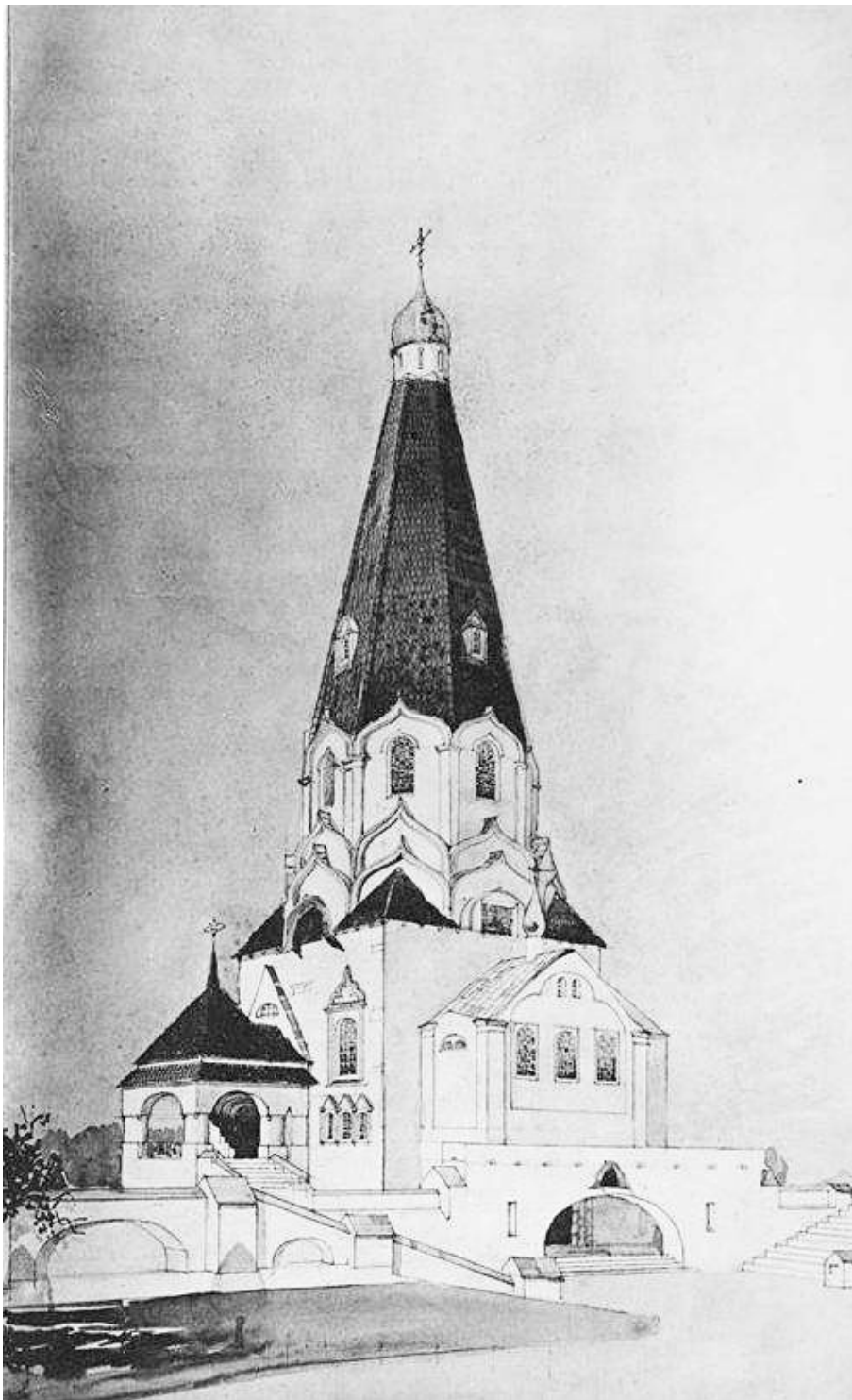
Рис. 1. Проект храму пам'ятника в ім'я Святого чудотворця Миколая на Звіринці у Києві. Головний фасад

Після жовтневого перевороту 1917 р., природно, відбуваються відмова від усього, що було пов'язане з християнством, та впроваджувалися зміни у сфері офіційної меморіальної культури. При цьому робиться спроба витиснення колишньої поховальної обрядовості, і заміна її новою. Пропагандується проведення кремації та будівництва крематоріїв. У 1920-1930-х роках були розроблені проекти крематоріїв для різних міст.