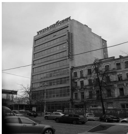
Рис. 7 Будівля Республіканського «Будинку моделей» (зараз будівля Укргазбанку), 1969 р., функціоналізм

Прикладом невдалого вторгнення в історичну забудову може також служити будівля Республіканського «Будинку моделей» Міністерства побутового обслуговування населення УРСР, побудована в 1969 році (зараз будівля Укргазбанку) за адресою вул. Вел. Васильківська, 39 (Рис. 7).