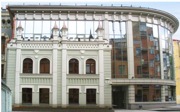
Рис. 5. Адміністративна будівля, 2013 р., гол. арх. О. Коваль

Гармонійний результат вписаного нового архітектурного об'єкта в історичне середовище за принципом контрасту досягнутий також у проекті адміністративної будівлі по вул. Інститутська 11-б, побудованого в 2013 році (авторський колектив: ГАП О. Коваль, арх. О. Сокіл, Н. Поправка, О. Шутова) (Рис. 5).