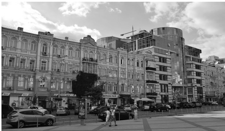
Рис. 6 Бізнес-центр «Сіті Плаза», 2003 р., арх. О. Донец

Контрастне рішення має, на жаль, і невдалі приклади. До цих випадків більш підходить слово дисонанс. Так, наприклад, масивна будівля бізнес-центру «Сіті Плаза» з досить грубим фасадом зі скла і бетону по вул. Вел. Васильківська 62/64 неделікатно розриває ряд витончених історичних фасадів у стилі неоренесанс , створюючи враження деякої зневаги до історичного минулого тільки підкреслюючи її чужорідність. (рис. 6)