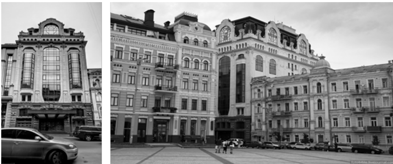
Рис. 1. Адміністративна будівля, 2010 р., Архітектурне бюро «Смирнов і К°»

До нових будівель, які вклинюються у фронт історичної вулиці, пред'являються досить жорсткі вимоги: збереження типу забудови, щоб не порушити звичний для городян архітектурно-художній вигляд вулиці, силуетності забудови (обмеження висоти поверхів і всього обсягу), коректна пластика фасаду нової будівлі (пропорції вікон, декору та інших деталей, співвідношень з оточенням), залежне від сусідніх фасадів рішення фактури та кольору (матеріал облицювання) і т. ін. Найчастіше цей принцип застосовується в ситуації брендмауерної забудови, виконується також прив'язка до сусідніх будівель єдиною карнизною лінією. Відповідно до цього принципу зведена Адміністративна будівля за адресою пров. Рильський, 4, вписана в забудову стилю еклектика Архітектурним бюро «Смирнов і К». (Рис. 1)