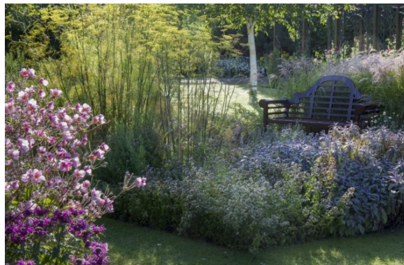
Рис. 5. Дождевой цветник с использованием кустарниковых и древесных растений

В мире дождевые сады как объекты фиторемедиации создаются уже около 40 лет. По всему миру дождевые сады входят в программу устойчивого развития города. Так, в США развиты такие направления как «Экологическое Управление Ливневыми стоками» (Ecological Stormwater Management - ESM), а также «Low Impact Design - LID» (технология экологически щадящего подхода к дизайну территории, цель которого - управление городскими ливневыми стоками). В Великобритании есть похожая программа – «Устойчивые дренажные системы» (Sustainable Drainage Systems SuDS), в Австралии развита технология управления ливневыми стоками «Water Sensitive Urban Design - WSUD». Все эти подходы направлены на создание устойчивой системы городского дренажа, и дождевые сады здесь являются ключевым элементом [3].