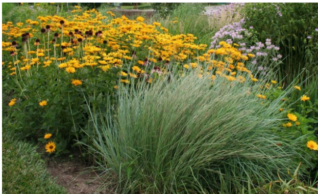
Рис. 4. Дождевой цветник с использованием злаковых и цветущих растений