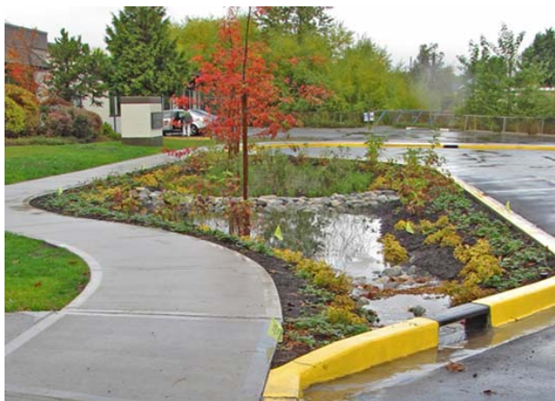
Рис. 2. Дождевой сад, расположенный в городском пространстве