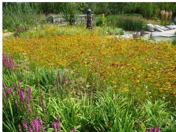
Рис. 3. Дождевой сад, расположенный у водоема

Есть, однако, критерии, которые применяются во всех случаях: