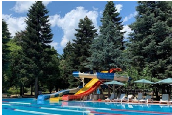
Рис. 4. Міжнародний дитячий спортивний табір РОСІЦА на курорті Св. Константин и Елена, Болгарія

У сучасній Україні архітектура оздоровчої галузі розвивається недостатнім темпом. Основні структурні елементи оздоровчої архітектури, якими є: курортні готелі, пансіонати, дитячі табори, центри здоров'я, морально та фізично застаріли.