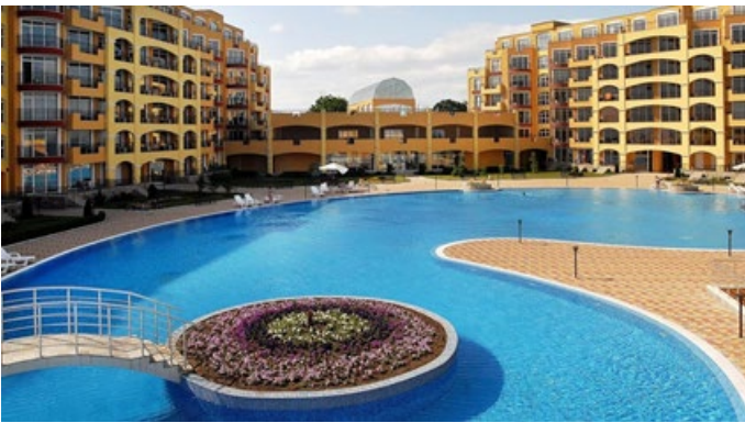
Рис. 3. Дитячий табір Midia Grand Resort, Болгарія