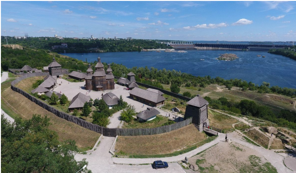
Рис. 3. Національний заповідник «Хортиця», острів Хортиця, Запорізька область, Україна

Проведене дослідження сучасних тенденцій класифікації об'єктів культурної спадщини з урахуванням чинного вітчизняного законодавства дало можливість запропонувати такий склад компонентної структури спадщини (рис. 4).