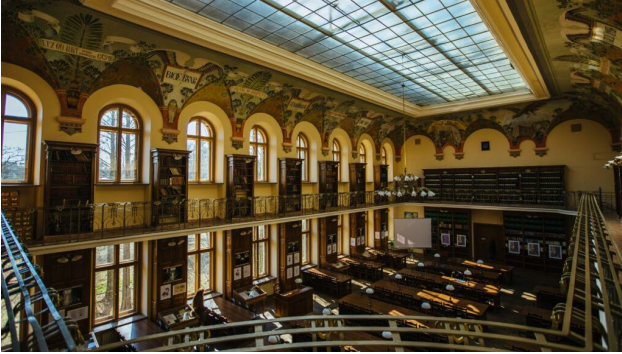
Рис. 5. Наукова бібліотека ЛНУ імені Івана Франка, Львів, Україна

Території спадщини об'єднують у своєму складі історичні населені місця (рис. 6) (історичні поселення), історико-культурні заповідники, центри (осередки) народних художніх промислів і ремесел, релігійні центри, етнографічні об'єкти, пам'ятки садово-паркового мистецтва, ландшафтні пам'ятки та території всесвітньої спадщини.