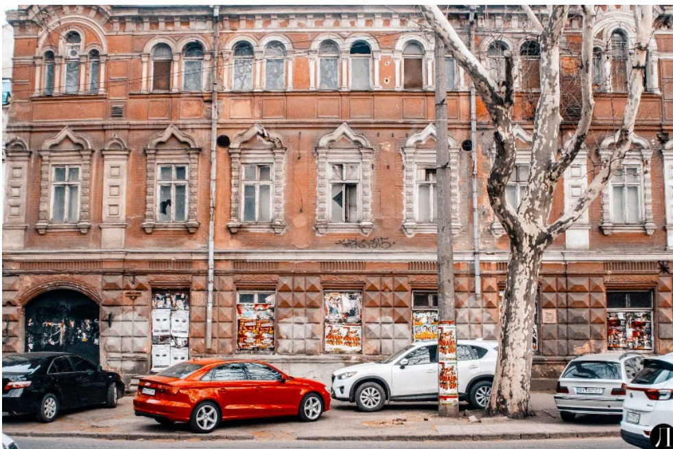
Рис. 7. Друкарня Е. Фесенка в Одесі, Україна

Однак, не дивлячись на існуючу нормативну-правову базу, управління архітектурними культурними пам'ятками України потребує ретельного контролю та доопрацювання. Адже на практиці забудові та зносу підлягають сотні об'єктів культурної спадщини, наприклад друкарня Е. Фесенка в Одесі (рис. 7).