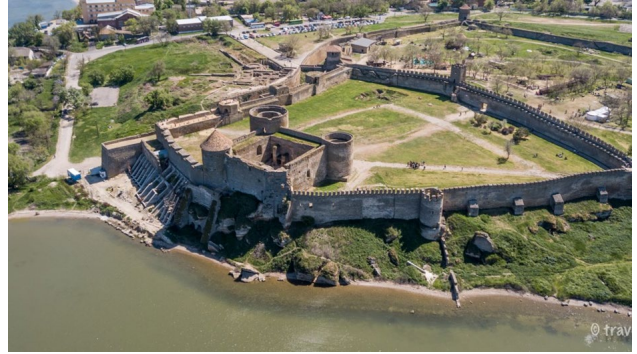
Рис. 6. Аккерманська (Білгород-Дністровська) фортеця, Україна, найбільша фортеця, що збереглася у Східній Європі [11]

Відповідно слід розширити понятійно-термінологічний апарат територій спадщини, згідно з яким історичне населене місце – це місто, селище чи село, яке зберегло повністю або частково свій історичний ареал з об'єктами культурної спадщини і пов'язані з ними розпланування та форму забудови, типові для певних культур або періодів розвитку, та занесене до Списку історичних населених місць [8].