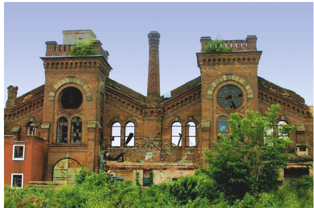
Рис. 2. Завод Краян. Промислова територія м. Одеса, Україна

Перші кроки в напрямі розроблення теорії та практики впровадження унікальних історико-культурних архітектурно-містобудівних територій зроблено і в Україні. Зокрема, К. М. Горб запропонував концепцію територій спадщини особливої охорони. Схему оцінювання потенціалу розвитку таких територій апробовано на прикладі Національного заповідника «Хортиця» (Запорізька область) (рис. 3) [5].