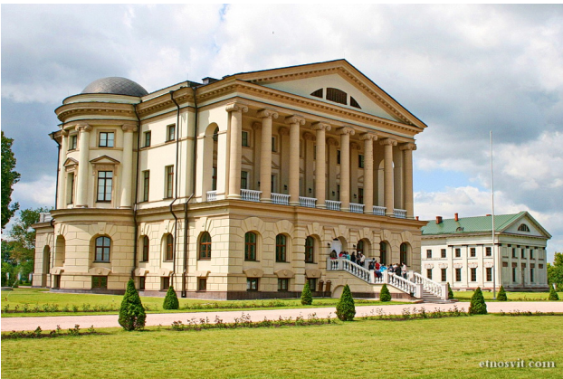
Рис. 1. Палац Кирила Розумовського, Батурин, Чернігівщина, Україна