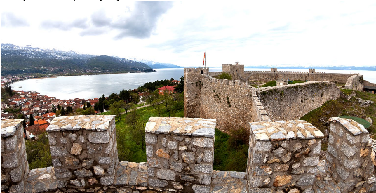
Рис. 4. Фортеця Охрида (990-і рр.)

З 990 до 1015 року Охрид став столицею Болгарського царства царя Самуїла, який переніс її сюди, після того, як східна частина Болгарії була завойована Візантією в 992 р. Йому ж приписують будівництво фортеці, яка збереглася до наших днів і домінує над містом, та розташована на пагорбі (рис. 4). Археологи встановили, що болгари зводили фортецю, використовуючи вже наявні укріплення, ранні з яких, датовані IV в. до н. е., імовірно, будувалися за наказом Філіпа II Македонського (батька Олександра Великого). З 990 до 1018 року в Охріді була своя патріархія. Після завоювання Охрида Візантією в 1018 році, в Охріді залишився лише архієпископ Охридської архієпископії, який підпорядковується патріарху константинопольському. За правління Візантії було збудовано велику кількість храмів. [2, 6]