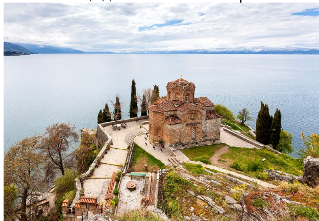
Рис. 6. Церква Святого Іоанна Канео

Церква є хрестоподібною будовою з прямокутною основою, має тристоронню апсиду на східній стороні. Передбачається, що архітектор створював план церкви з урахуванням як візантійських, так і вірменських архітектурних елементів (особливо під час оформлення восьмикутного купола). Незадовго до прибуття турків до Північної Македонії церква в XIV столітті зазнала реконструкції. Згідно з літописами, церква Святого Іоанна Канео розташовувалась неподалік церкви Святих Костянтина та Олени. Після захоплення турками території Північної Македонії почалося вичерпання духовного життя з XVII по XIX століття (одна з небагатьох ікон, що збереглися, датується 1676 роком).