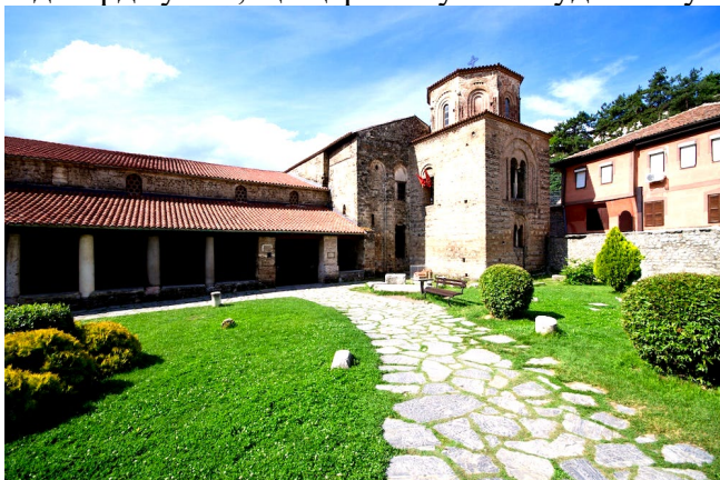
Рис. 5. Церква Святої Софії

Ще однією з найвідоміших церков Охрида є Церква Святого Іоанна Канео (Церква Святого Іоанна Богослова) – храм Македонської православної церкви, розташований на скелі над пляжем Кане з видом на Охридське озеро (рис. 6). Храм споруджено на честь Іоанна Богослова. Точна дата будівництва церкви невідома, проте, згідно з документами про церковну власність, церкву було збудовано до 1447 року. Археологічні розкопки підтверджують, що церква була побудована у XIII столітті ще до Османської імперії.