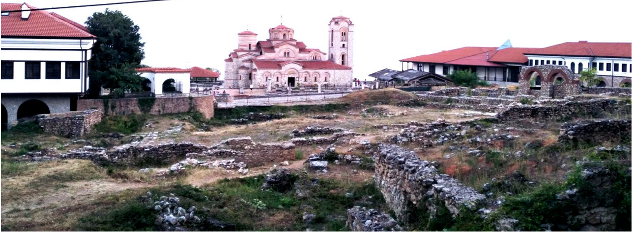
Рис. 3. Пагорб Плаошник із церквою св. Пантелеймона (XXI ст.)

З 990 до 1015 року Охрид став столицею Болгарського царства царя Самуїла, який переніс її сюди, після того, як східна частина Болгарії була завойована Візантією в 992 р. Йому ж приписують будівництво фортеці, яка збереглася до наших днів і домінує над містом, та розташована на пагорбі (рис. 4). Археологи встановили, що болгари зводили фортецю, використовуючи вже наявні укріплення, ранні з яких, датовані IV в. до н. е., імовірно, будувалися за наказом Філіпа II Македонського (батька Олександра Великого). З 990 до 1018 року в Охріді була своя патріархія. Після завоювання Охрида Візантією в 1018 році, в Охріді залишився лише архієпископ Охридської архієпископії, який підпорядковується патріарху константинопольському. За правління Візантії було збудовано велику кількість храмів. [2, 6]