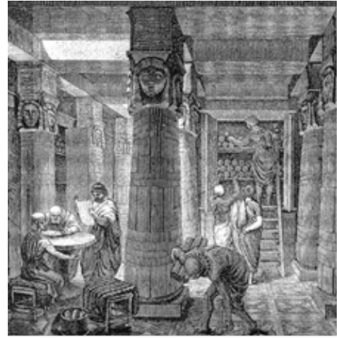
Рис.1. Стародавні бібліотеки світу.

У Стародавньому Єгипті бібліотеки створювалися при палацах та храмах. Напис на одній із стародавніх бібліотек Єгипту говорить: «Аптека для душі». Бібліографічний фонд найвідомішої Олександрійської бібліотеки стародавнього світу, у період розквіту складався з 700 – 800 тисяч текстів багатьма мовами. У стародавньому Вавилоні, ще в другому тисячолітті до н.е., була створена одна з найперших бібліотек на земній кулі. У ній зберігалися манускрипти, які докладно розповідали про так званий всесвітній потоп. В бібліотеці храму Кута перебували манускрипти, які описують історію створення світу та війну велетнів. Перський вчений візир Сахіб (середина X ст.) пристрасно любив книги, у його бібліотеці налічувалося близько 117 тис. рукописів.