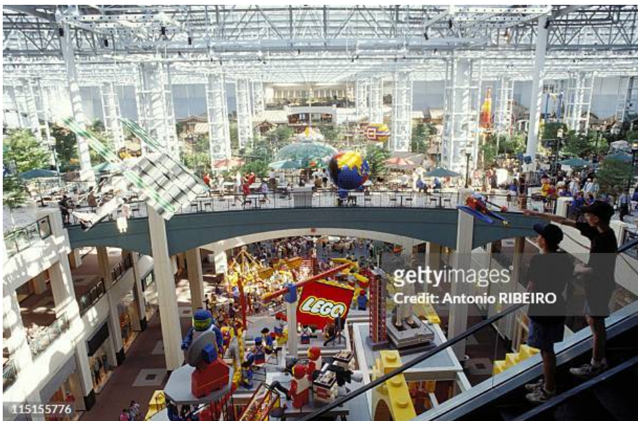
Рис. 2. Торговий центр Mall of America в Міннесоті