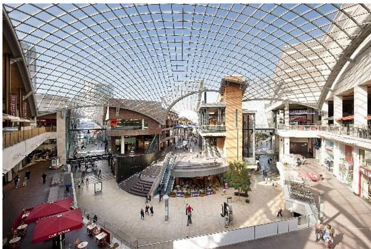
Рис.3. Торговий центр Cabot Circus у Брістолі, Англія

Дуже важливо, щоб торгові центри були набагато більше, ніж магазини. Ми бачимо, як співвідношення орендар/громадський простір змінюється від поточних 70/30 до 60/40 або навіть 50/50. Коли це станеться, ці розширені громадські простори потрібно буде планувати та програмувати протягом року, подібно до виставки. Ними керуватимуть більше як контентом і медіа, а не нерухомістю. Змішані вживані розробки пропонують споживачам привабливу інтегровану спільноту, в якій можна жити, працювати та робити покупки. Вони також служать для створення додаткового трафіку для торговельних центрів, максимізуючи віддачу від інвестованого капіталу. Іншими можливостями комерційної нерухомості, які можуть додати альтернативні джерела доходу, є готелі, офісні будівлі та аеропорти.