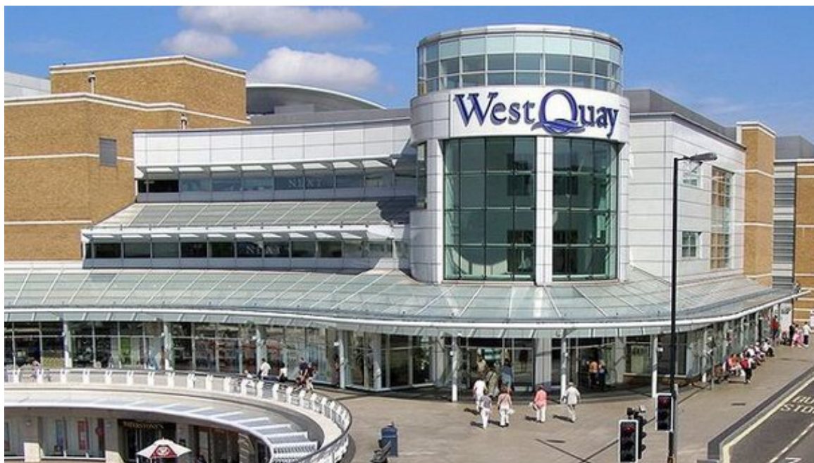
Рис. 4. Торговий центр WestQuay Англія