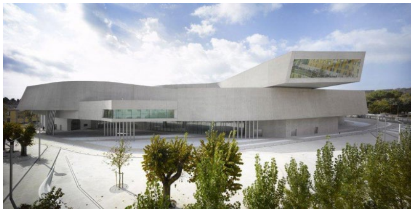
Рис. 5. Національний музей мистецтв XXI століття – МАХХІ

Будівля музею, будівництво якої обійшлося в 150 мільйонів євро, побудована за проектом відомої архітекторки Захи Хадід. Це найбільше спорудження з усіх нею спроектованих на сьогоднішній день. Зведення спіралевидної бетонної споруди площею в 27 тисяч квадратних метрів тривало 11 років. Основою для побудови послужив комплекс казарм Монтелло - їх фасад став головним для МАХХІ: там розташований його парадний вхід. Казарми не відрізнялися особливими архітектурними достоїнствами. Від них залишився один лише пересічний класичний фасад.