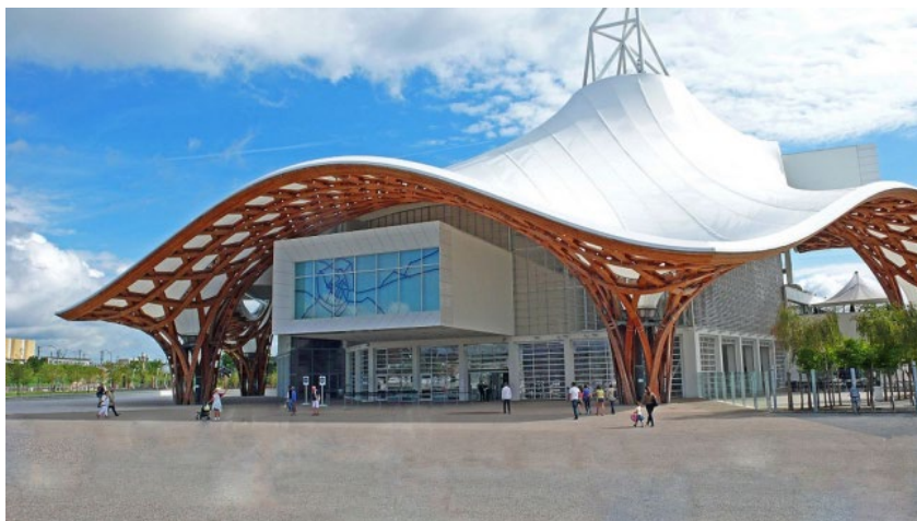
Рис. 6. Центр Помпиду-Меє

Цього разу він наклав музейну споруду майже прозорим гігантським капелюхом у мереживі дерев'яних крокв, хвилясті поля якої зв'язали всі частини музейного комплексу (рис. 6).