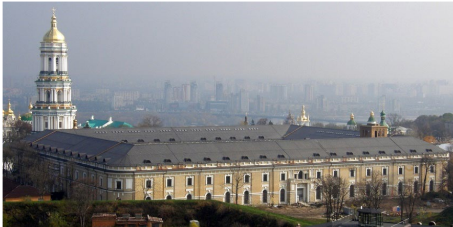
Рис. 7. Мистецький арсенал

Меллера (рис. 7). Цікаво, що Меллер проєктував будівлю, з урахуванням її можливого перепрофілювання, так як писав про свою роботу: "Настане час, і ви побачите, що я побудував цей будинок не для фортеці, а для людей" [12].