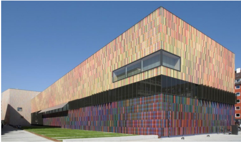
Рис. 4. Фасад Музею Брандхорста

залах обладнані спеціальні зони відпочинку - меблі для них розроблялися дизайнерами за спеціальним замовленням.