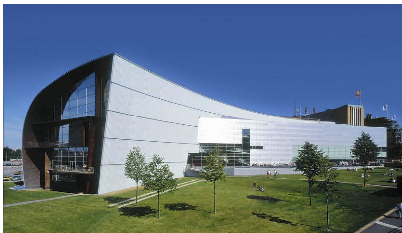
Рис. 2. Музей сучасного мистецтва Кіасма

Музей Леопольда (нім. Leopold Museum) - художній музей у складі Музейного кварталу у Відні, Австрія.