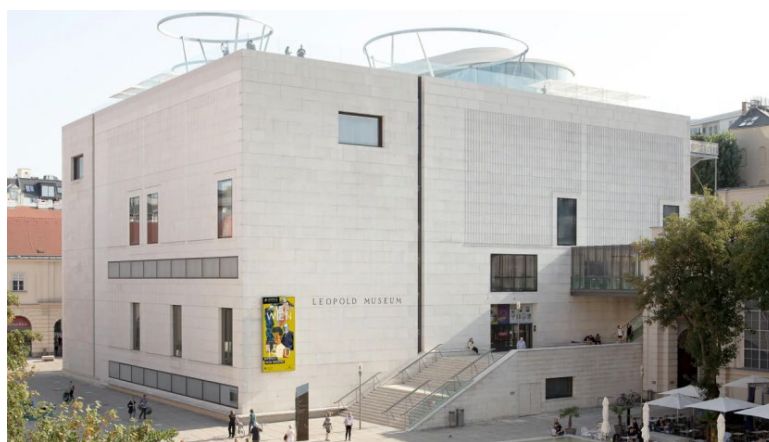
Рис. 3. Музей Леопольда

Музей Леопольда відкрився 21 вересня 2001 року в ході створення віденського культурного ареалу Музеумсквартір, що займає по своїх розмірах восьме місце в світі. На його урочистому відкритті був присутній президент Австрійської Республіки Томас Клейстіль. Будівля у формі прямокутника, площею в 12600кв.м, облицьований білим черепашником, побудована за проектом архітектурного бюро Ortner & Ortner. Вхід в музейний будинок оформлений парадними сходами шириною в 10м. Підлоги виставкових залів викладені дубовим паркетом, а всі видимі декоративні металеві деталі виконані з покритою патиною латуні (рис. 3).