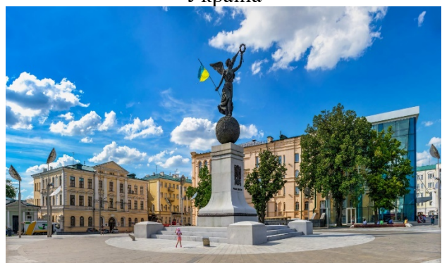
Рис. 15. Майдан Конституції, м. Харків, Україна

Центральний парк культури та відпочинку у Харкові розташований у центрі міста. Це чудове місце для відпочинку з дітьми, для вечірніх прогулянок і навіть для того, щоб відзначити свято. Парк чудово підходить для активних людей, і тут збирається дуже багато