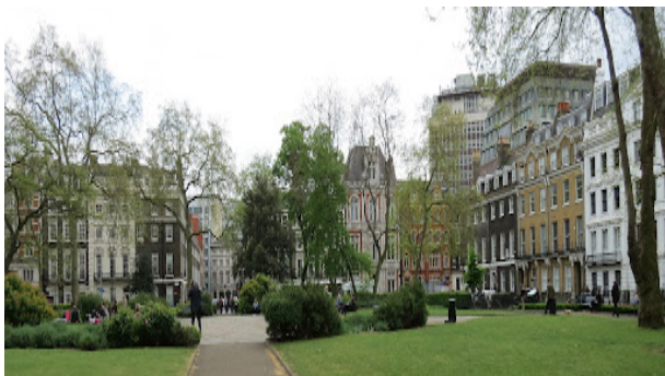
Рис. 1. Блумсбері, Лондон, Великобританія

18-го і 19-го століть скверів, до сих пір є одним з найпрестижніших і привабливих для життя районів Лондона (рис. 1).