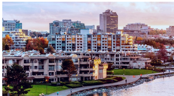
Рис. 2. Район Фолс-Крік, Ванкувер, Канада

До 50-х років минулого століття район затоки Фолс-Крік, що примикає до історичного центру Ванкуверу, був промисловим ядром міста. У 1960 році пожежа, що виникла на території деревообробної фабрики, стерла його з обличчя землі. Ідея міської влади прокласти по берегу затоки швидкісну автотрасу без обговорення з громадськістю натрапила на потужний опір впливових міських активістів. Підсумком багаторічних дебатів став Офіційний план розвитку, прийнятий в 1972 році. По ньому працюють і зараз. Причому упор в ньому робиться на максимальне розмаїття функцій, безпеку і комфорт міського середовища (рис. 2).