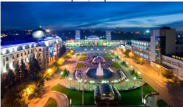
Рис. 12. Привокзальний майдан, м. Харків, Україна