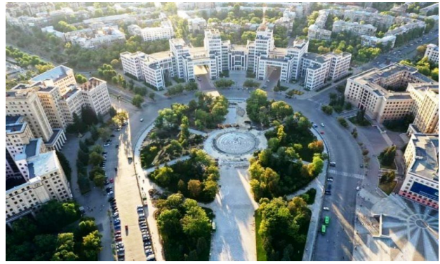
Рис. 9. ХНУ, Держпром, Площа Свободи, м. Харків, Україна