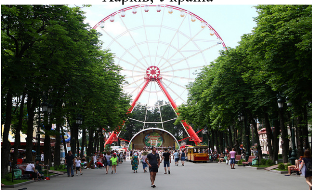
Рис. 14. Центральний парк культури та відпочинку у Харкові, Україна