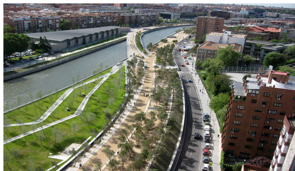
Рис. 5. Набережна річки Мансанарес, Мадрида