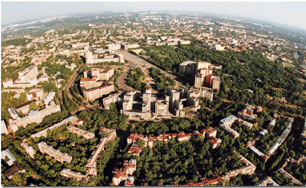
Рис. 8. Майдан Свободи, м. Харків, Україна