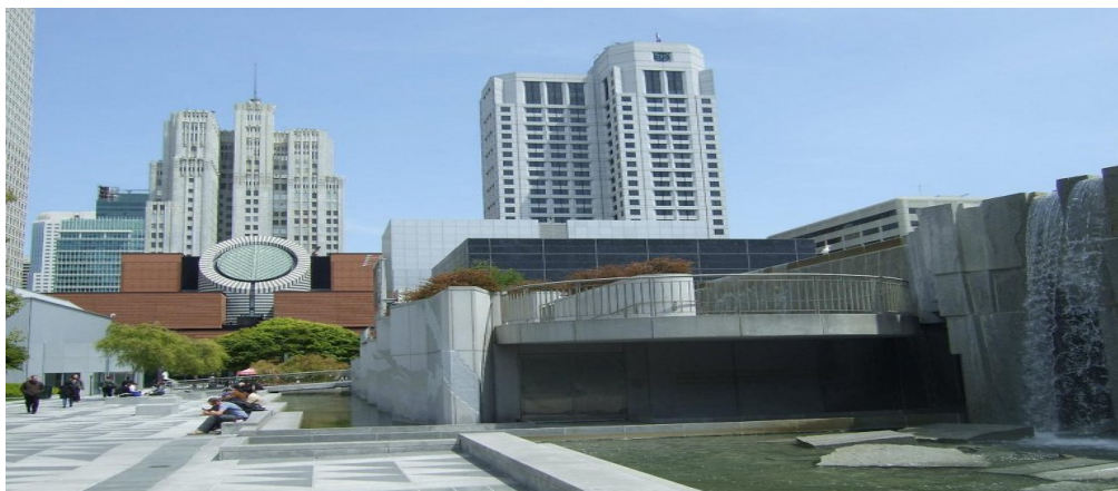
Рис. 3. Сади Йерба-Буена, Сан-Франциско, США.

Тут є не тільки житло (в тому числі соціальне), але і офісні та адміністративні будівлі, а також безліч магазинів і ресторанів на перших поверхах. Сьогодні район Фолс-Крік вважається одним із найкомфортніших та привабливих місць для життя на всьому північноамериканському континенті.