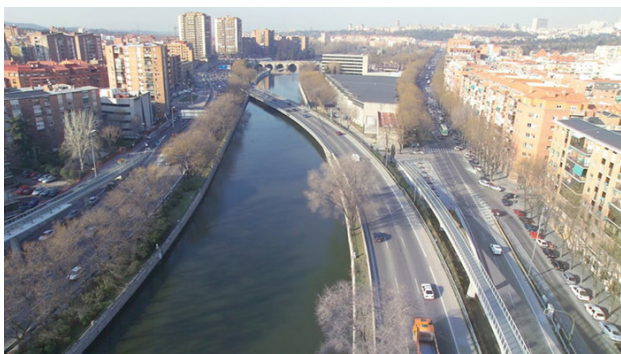
Рис. 4. Набережна річки Мансанарес до 2006 року. Іспанія

До 1960 року чисельність населення Мадрида перевищила 2,26 млн. люд., а 1970 року - досягла 3,15 млн. люд. У 70-ті роки Мадрид, як і всі великі міста Європи, потонув в автомобілях. Автомобіль обожнювався і передбачалося, що це єдиний перспективний вид транспорту - такий собі вінець творіння людини. У Мадриді, звичайно ж, розгортається активність з автомобілізації міста. Цінність бульварів у розумінні городян зникає, на їхньому місці зводяться широкі магістралі, розвивається система підземних та наземних автостоянок. Владою Мадрида на початок 2000-х було прийнято проект серйозної реконструкції шосе. Цей проект став частиною більш масштабної діяльності щодо зміни транспортної ситуації у всьому місті. Проект Madrid Río - це близько 650 га оновленої території, яка раніше була депресивним районом Мадрида. Ось, що було на набережній Мансанарес до 2006 року і що стало після закінчення реконструкції у 2011 році (рис. 4, 5, 6, 7).