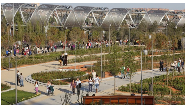
Рис. 6. Набережна річки Мансанарес, Мадрид