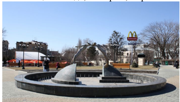
Рис. 11. Пам'ятник закоханим, пл. Архітекторів, м. Харків, Україна