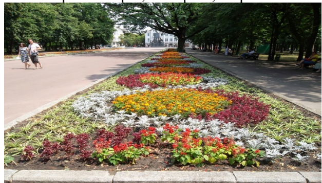
Рис. 13. Сад Шевченко, м. Харків, Україна