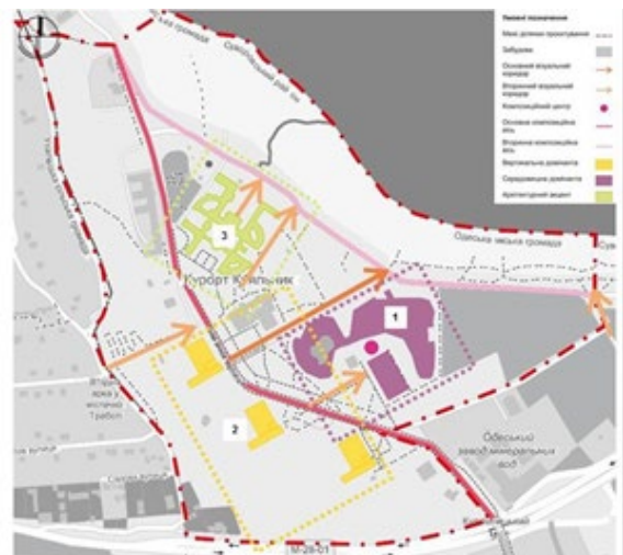
Рис. 4. Схема існуючої композиційної структури курорту Куюльник

Саме ця вісь тримає навколо себе підрядні елементи й формує площину фронтального екрана, що видно з боку акваторії лиману. Будівлі житлових корпусів при своєму розміщенні уздовж центральної осі, в поєднанні з фронтальною площиною схилу утворюють своєрідну ширму на задньому плані композиції. Другорядна ж вісь, що проходить уздовж побережжя лиману, замикає форму ділянки, робить її більш стабільною. Основні та другорядні візуальні коридори направлені від головної осі в бік лиману. Вони закріплені за допомогою або