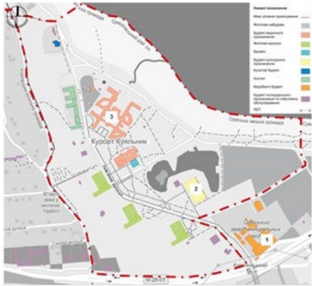
Рис. 1. Схема інфраструктури курорту «Куюльник»

узбережжя від основної ділянки санаторію. Основні пішохідні доріжки пронизують зони навколо житлових корпусів та поблизу поліклініки й палацу культури. У зонах позаду житлових корпусів та на самому узбережжі лиману ці шляхи є менш розвинутими. Втім варто зазначити, що пішохідні доріжки виконують не лише функцію горизонтальних, а подекуди й вертикальних зв'язків на території. Так у західній частині ділянки, що розглядається, пішохідні шляхи проходять скрізь схил та з'єднують його верхню та нижню точки.