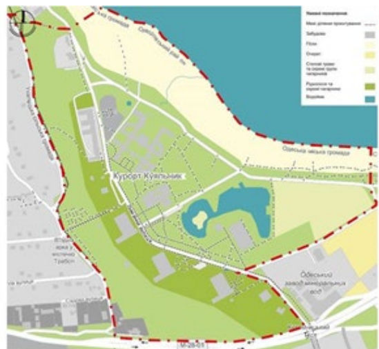
Рис. 3. Схема природного ландшафту курорту Куюльник

Композиційно ділянку можна розбити на головні та другорядні елементи, що працюють у тісному зв'язку. Так, перші створюють каркас, на якому розташовуються другорядні елементи. Для ділянки санаторію «Куюльник» характерним є поділ на дві нерівні частини завдяки головній осі – вул. Лиманній (рис. 3, 4).