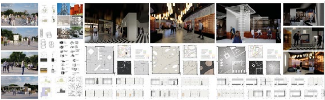
Рис. 6. Дизайнерська частина дипломного проекту на ділянці курорту «Куяльник»