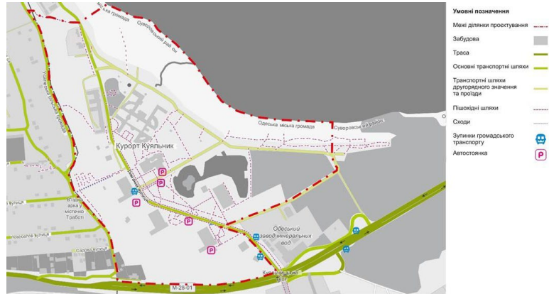
Рис. 2. Схема транспортно-пішохідних шляхів курорту «Куюльник»

Композиційно ділянку можна розбити на головні та другорядні елементи, що працюють у тісному зв'язку. Так, перші створюють каркас, на якому розташовуються другорядні елементи. Для ділянки санаторію «Куюльник» характерним є поділ на дві нерівні частини завдяки головній осі – вул. Лиманній (рис. 3, 4).