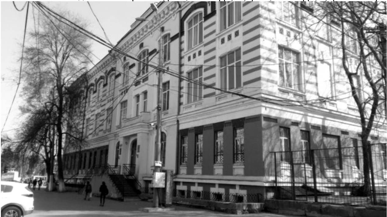
Рис. 6. Будівля Одеського національного економічного університету (фото, 2021 р.)