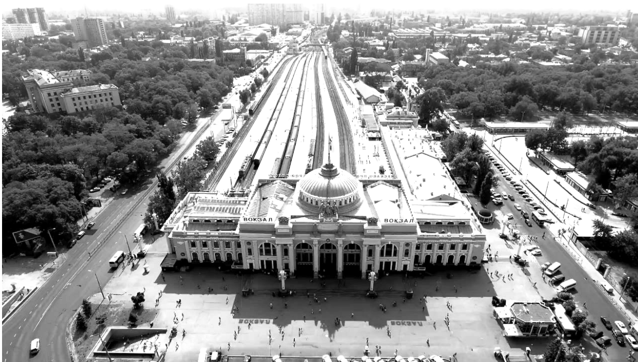
Рис. 10. Залізничний вокзал «Одеса Головна» (фото, 2021 р.)

Ця інфраструктура швидко обросла житловою і промисловою забудовою і потім, уже в радянські часи, після будівництва величезних житлових масивів, опинилася в географічному центрі міста з мільйонним населенням. Вокзал від самого початку був запланований «тупиковий», з притаманними цьому типу вокзалів недоліками. А залізничні колії, що ведуть до нього, стали формувати депресивні ділянки в центрі міста. Усі транспортні лінії виявилися витягнуті вздовж залізниці та сформували тупикові «зони застою» біля залізничних транзитів. При тому що промислові об'єкти, розташовані вздовж колій поступово припинили існування, або, змінивши специфіку, послужили джерелом формування занедбаних територій. В'їзд у місто веде через зони сумнівної привабливості, і вкрай неприваблива «зустріч» шкодить туристичному іміджу міста відомого своєю архітектурою. Проте, ці ділянки мають великий містобудівний потенціал до реновації.