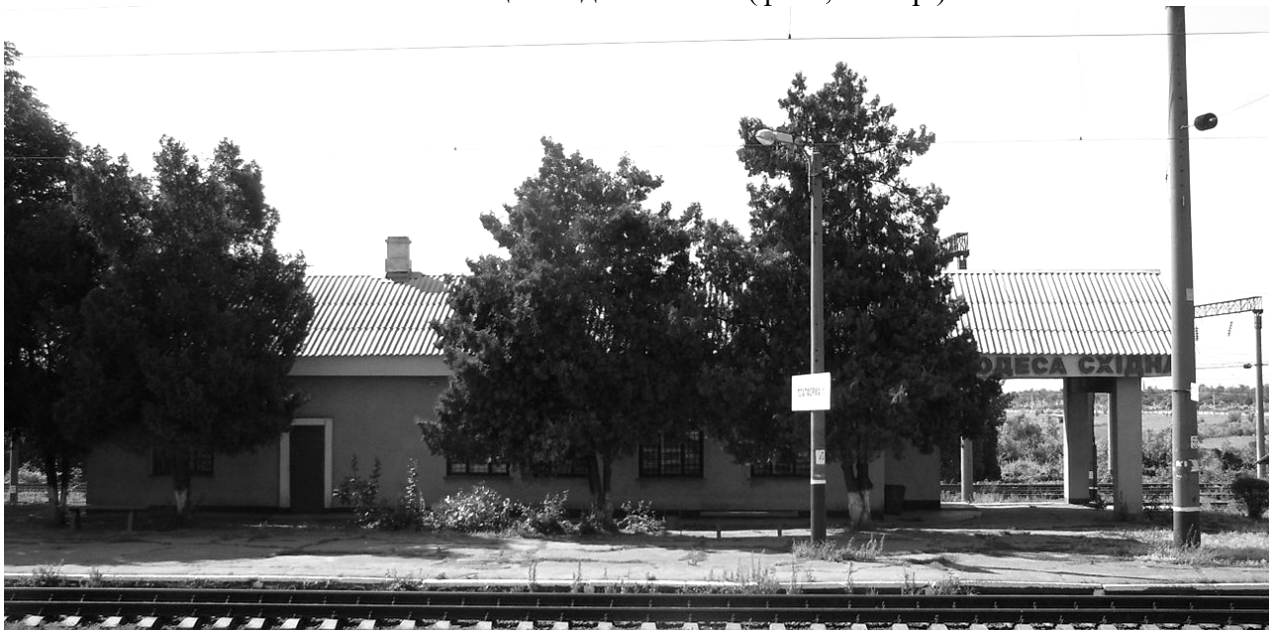
Рис. 8. Станція «Одеса-Східна» (фото, 2023 р.)

З розвитком залізничного транспорту на початку 20 ст. були сформовані великі складські комплекси, які пропускали через себе значну частину товарів. На околиці міста Одеса виникло так зване Хлібне Містечко, де між залізничних колій була сформована щільна забудова зі складів і торгових площ. Залишки квартальної забудови Хлібного Містечка, яка була сформована залізничними колями, зараз стали кварталами міста, зберігши діючі рейкові колії тільки по краях квартальної забудови. (рис. 9) [11]