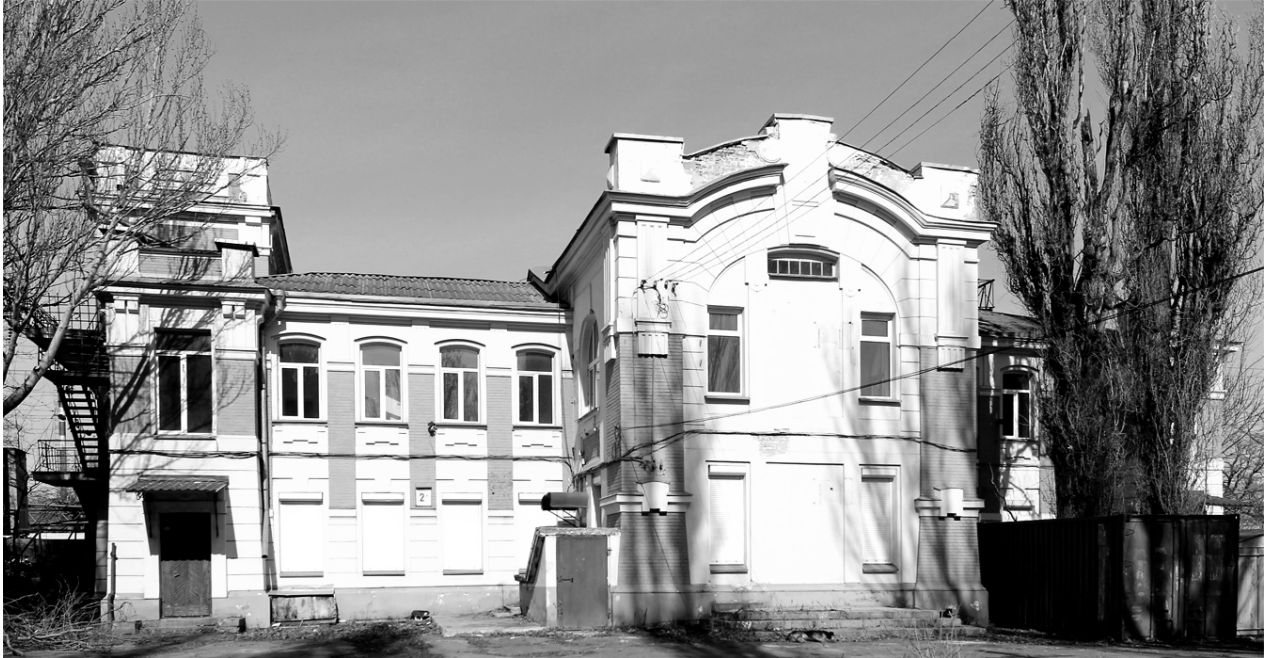
Рис. 7. Станція «Одеса-Мала» (фото, 2023 р.)

8. Станція «Одеса-Східна». У 1970-80-ті роки як другий одеський вокзал почали використовувати станцію Одеса-Східна. На ній робили зупинку та обслуговувалися пасажирські потяги. Через віддаленість від центру основного житлового масиву Суворовського району, на станції існувала зупинка всіх пасажирських поїздів, що йдуть у східному напрямку. (рис. 8) [13]