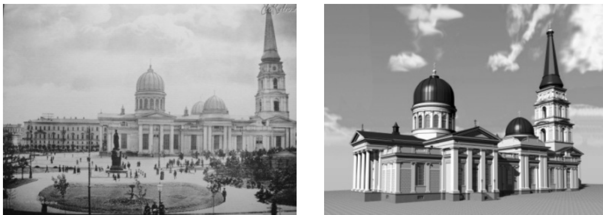
Рис. 1. Одеський кафедральний Спасо-преображенський собор до сноса (слева), вид с проектною 3Д моделі (справа)

Академічний или научно-аналитический подход . Даний підхід тесно зв'язан с музеєфікацією (но не тільки с нею). В его рамках может быть обоснована значимость того или иного артефакта, как репрезентативной вещи, следовательно, имеющей право на атрибуцию и включение в коллекцию предметов, значимых с культурно-исторической точки зрения и потому сохраняемых в своем подлинном виде.