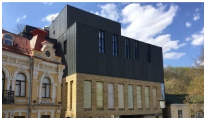
Рис.5. Театр на Подоле. Реконструкция. Арх. О. Дроздов

Выводы. Вышеперечисленные подходы вскрывают содержательный и разнообразный массив образов, информации, знаний, данных и явлений городской среды, которые значительно обогащают городскую жизнь, как сложный культурный феномен. Этот массив помогает обеспечить материалом разнообразные сферы городских практик, работающих со сложным и интересным миром общества, культуры и истории и формирующий социальный и культурный капитал города. Необходимо создать систему практик в рамках городского планирования, которое ныне нуждается в серьезном обновлении, а, по сути, необходима новая эффективная система городского планирования, построенная на современной технологической, организационной и концептуальной основе. Полагая что, современный город может устойчиво развиваться только в рамках сложных комплексных подходов, выходящих за пределы отдельных дисциплин, мы намерены вести дальнейшие междисциплинарные исследования передовых тенденций в городском планировании и осуществлении проектов комплексной направленности, а также исследовать вопросы управления процессами формирования городской среды, учитывающих культурно-историческое наследие и новые потребности города.