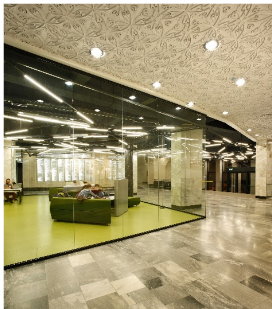
Рис. 3. Американський університет Вірменії. Інтер'єр [6]

У 2016 році був здійснений проект реставрації інтер'єру головного холу Американського університету Вірменії в Єревані студією Storaket (рис. 3). Ніби з кадрів фантастичних фільмів металеві стержневі конструкції, пов'язані з протяжними світлодіодними світильниками, проникають з фасаду вглиб будівлі. Химерним чином білі ліпні стелі поєднуються з великою кількістю скла і металу, світлий мармур контрастує з оштукатуреними в чорний колір балками під стелею і простором між ними, а по центру першого поверху яскравим зеленим островом розташувався ново обладнаний колабораційний освітній простір. Таким чином були виділені сценарні зони проєктованого простору, які мають особливу функцію. Також архітекторами проєкту були розроблені інтер'єри бібліотеки, простору для спільних досліджень, випробувального центру, аудиторії і робочої зони. Для того, щоб зробити простір більш легким і збільшити кількість освітлення в приміщеннях було використано багато скла у вигляді прозорих перегородок, які стирають кордони між навчальними та комунікаційними зонами. Загальна площа проєкту склала 1 730 квадратних метрів [6].