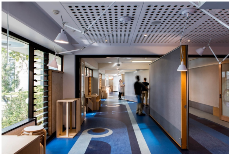
Рис. 4. Університет Квінсленда, Брісбен. Інтер'єр [7]

Для Університету Квінсленда, Брісбен, було вирішено розробити інтер'єр, який не тільки був би зручним робочим простором, але й надихав би своїх студентів (рис. 4). Яскравий декоративний розпис у вигляді зображень людей і абстрактних малюнків вкриває площини стін і підлоги. Розсувні перегородки допомагають змінювати конфігурацію навчального простору, легко перетворювати робочу майстерню у містку лекційну залу. Таким чином авторам проекту вдалося перетворити старі аудиторії, розраховані лише для якогось певного виду роботи, у гнучке навчальне поле, у якого відсутні кордони, а простори плавно змінюються один за одним. Довгі стержні світильників, закріплених на стелі, дозволяють згинати їх під будь-яким кутом для створення зручного направлено освітлення [7].