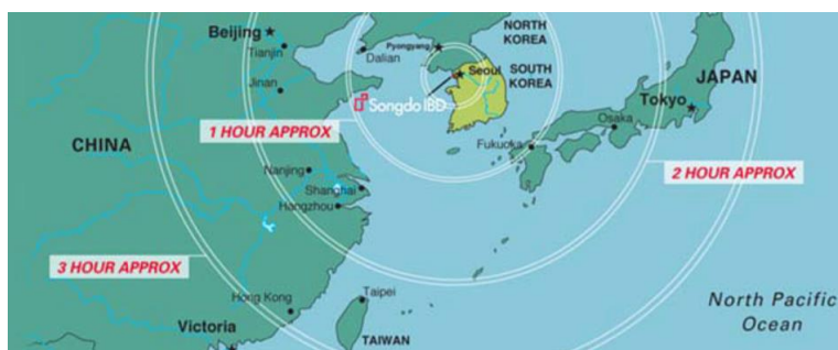
Рис. 4. Схема расположения Сонгдо на территории Восточной Азии.

Город задуман как модель "умного и устойчивого" города, как база для наземных испытаний передовой технологической инфраструктуры компании "CiscoSystems".