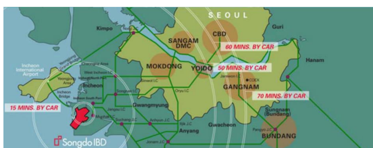
Рис. 5. Схема расположения Сонгдо на территории Южной Кореи

Экология и устойчивое развитие. В целях улучшения экологической ситуации согласно концепции стратегии устойчивого развития в Сонгдо применен ряд стратегий для минимизации ущерба окружающей среде и достижения максимальной энергетической независимости. Все основные здания строятся с учетом корейских экологических стандартов и американской системы сертификации «LEED». Для того что бы город оставался чистым, внедрена центральная пневматическая система удаления мусора, позволяющая исключить необходимость вывоза мусора автотранспортом [9].