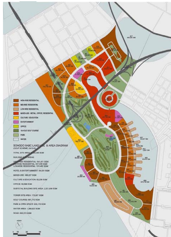
Рис. 6. Схема функционального зонирования Сонгдо.

1-высотные жилые дома, 2-здания средней этажности, 3-малоэтажные здания, 4-офисы и жилье, 5-культура/обучение, 6-офисы, 7-офисы, 8-гольф, 9-парк, 10-вода