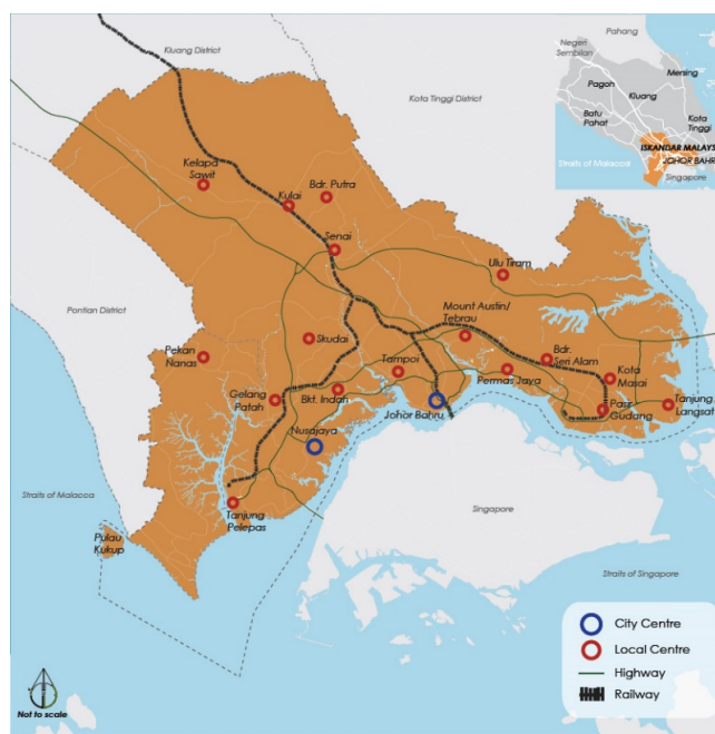
Рис. 1. Схема расположения города Ишкандар в регионе и схема территории города [1]

Планируется что Ишкандар станет крупнейшей особой экономической зоной, для Малазийского региона. Его концепцию характеризуют следующие слова: "...В рамках нашего "умного" города мы учитываем не только технологии и инфраструктуру, но еще и умных людей...". Цель развития – преобразование южного штата Джохор (Johor) в высокодоходную и устойчивую метрополию международного уровня.