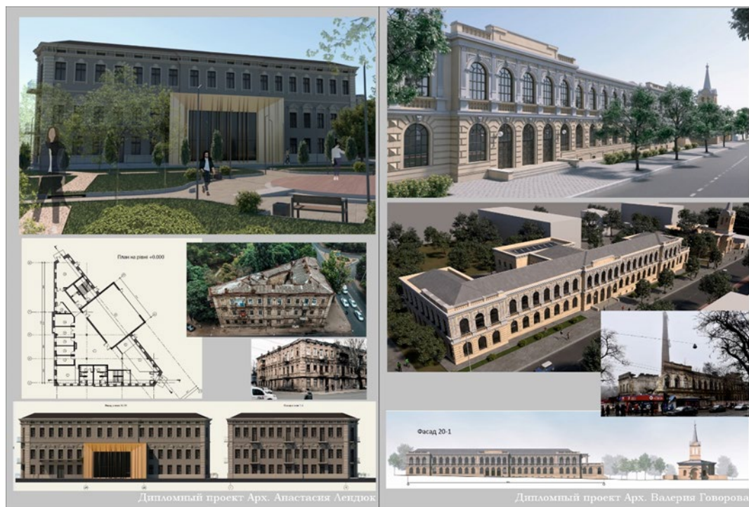
Рис. 3. Музыкальная школа на основе реновации и реконструкции доходного дома, арх. А. Лендюк (слева). Блестящая и смелая работа. Студенческий клуб (ХАБ). Реновация фабрики мороженого на ул. Старопортофранковской, арх. В. Говорова (справа). Здание, когда-то 2-я женская гимназия, сегодня находится в аварийном состоянии – будет продолжать разрушаться без нового функционального наполнения. Досконально выполненный проект