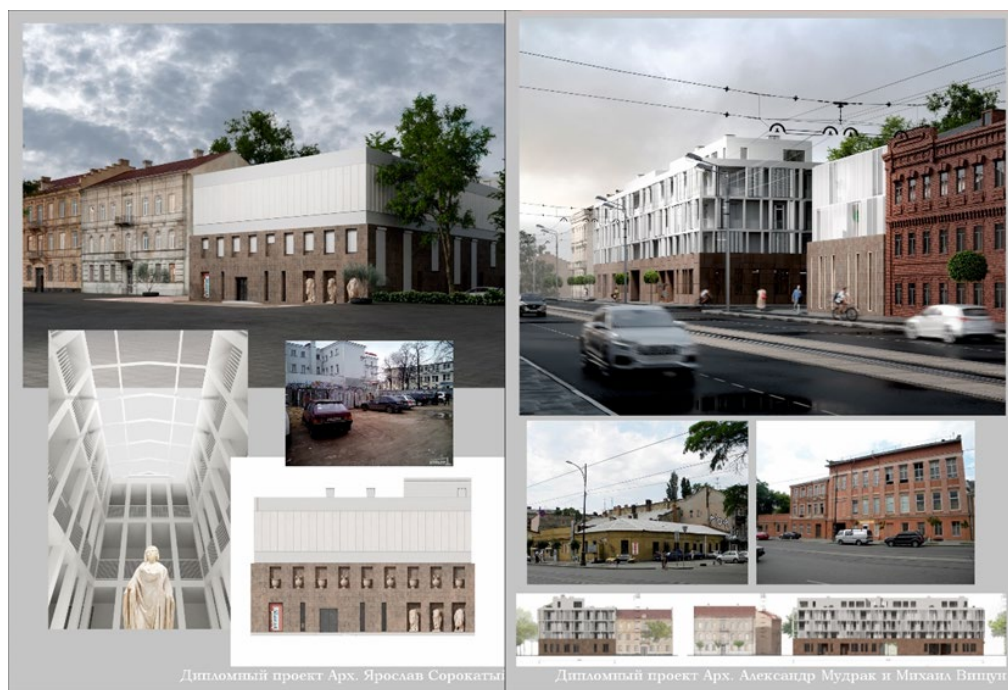
Рис. 4. Музей греческой культуры в переулке Красном, арх. Я. Сорокатый (слева). Жилое и офисное здания на пересечении ул. Тираспольской и ул. Асташкина, арх. А. Мудрак и М. Вищун