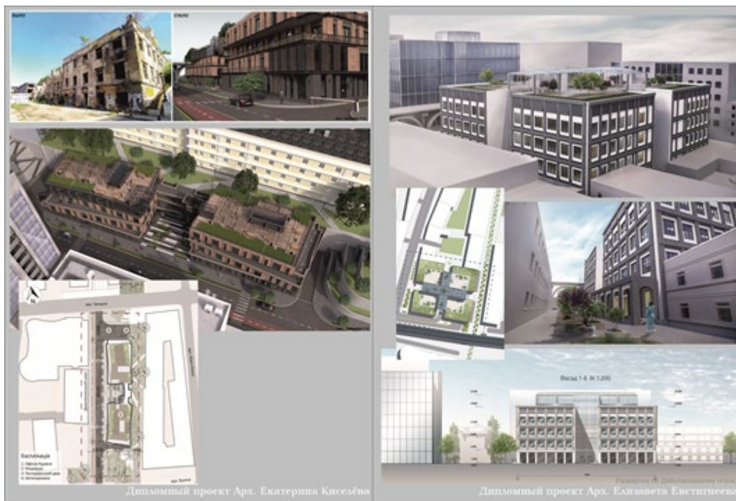
Рис. 2. Офисное здание на Деволановском спуске, арх. Е. Киселёва (слева). Прекрасное современное как результат тщательного архитектурного поиска и градостроительного анализа. Досуговый клуб на Деволановском спуске, арх. Е. Евстигнеева (справа). Чёткие пропорции, безукоризненно вписанные в окружающую застройку