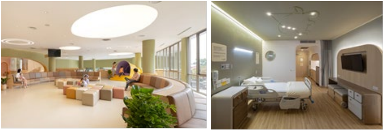
Рис.3. EKN Children Hospital Тайланд.

Створення комфортного середовища для цілодобового перебування пацієнта - важлива частина успішного процесу лікування.