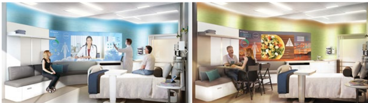
Рис.4. Дизайн-концепція компанії NBBJ, палати для пацієнтів.

Цифрова інтеграція в медичному напрямі це спосіб удосконалення в наданні кращих послуг, забезпечення комфортного перебування пацієнтів, відвідувачів та персоналу. Так розвиток електронних систем реєстрації призвів до скорочення потреб у великому числі залів очікування. Одним із прикладів цифрової інтеграції є дизайн-концепція компанії NBBJ, палати для пацієнтів (рис.4.), яка поєднує ідеї віртуального та особистого зв'язку з ефективністю та гнучкістю дизайну мікро-квартир.