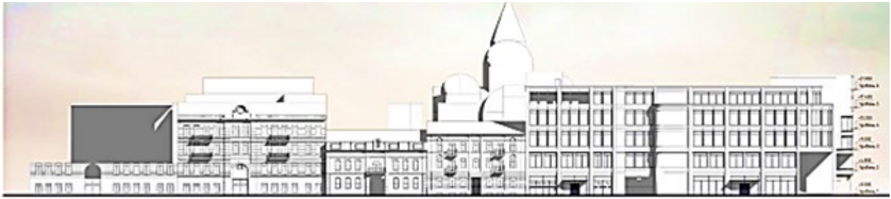
Рис.1. Громадсько-виставковий комплекс в історичному середовищі м. Одеси. Розгортка по вулиці лейтенанта Шмідта. Пропозиції – архітектор І. Лесів

Забудова цієї частини міста виникла ще в ХІХ столітті і носить характер невеличких кварталів з будівлями по периметру і внутрішніми дворовими просторами, що певним чином зумовлює формування нового об'єкту в її структурі (рис. 1, 2).