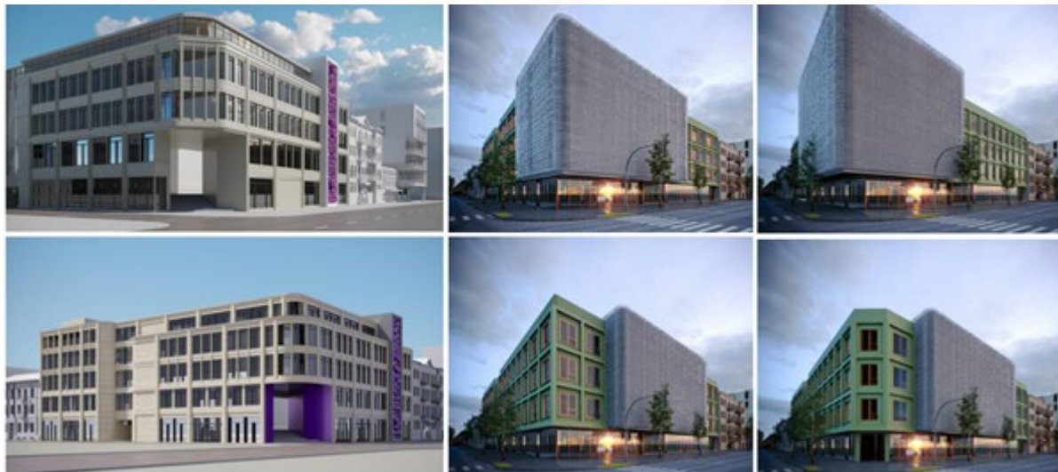
Рис. 3. Громадсько-виставковий комплекс в історичному середовищі м. Одеси. Пошуки фасадних рішень. Пропозиції – архітектор І. Лесів

На рівні архітектури – об'ємно-просторового рішення – розглядається створення дизайн-коду на основі історико-генетичного аналізу – своєрідного еволюційного дослідження – історико-генетичного коду міста (рис. 3).