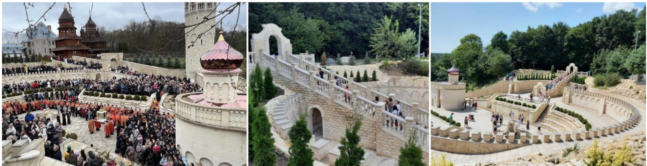
Рис. 5. Марійський духовний центр «Зарваниця», «Український Єрусалим»

Серед реалізованих прикладів сакральних комплексів можна відзначити греко-католицький Марійський духовний центр «Зарваниця», в якому створено «Український Єрусалим» – архітектурні копії християнських святинь з життя Ісуса Христа. Комплекс будували близько чотирьох років, він вміщує у свою структуру всі священні пам'ятки на шляху Ісуса Христа та наочно демонструє Станції на шляху до розп'яття, сходи покаяння, гора Голгофа із трьома хрестами, Гетсиманський сад, копія Гробу Господнього та ін. В комплексі використовується облицювання з натурального каменю, мощення з грубою фактурою, відповідне озеленення а також рослинні композиції [18] (рис. 5).