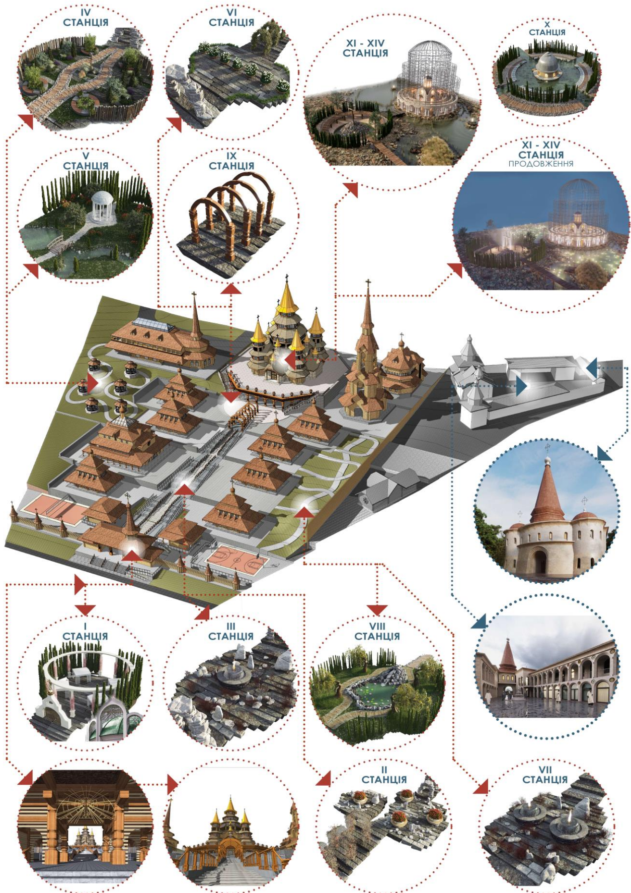
Рис. 3. Вираження православних символів чотирнадцяти Станцій Ісуса Христа в ландшафтно-рекреаційному оснащенні території монастирського комплексу