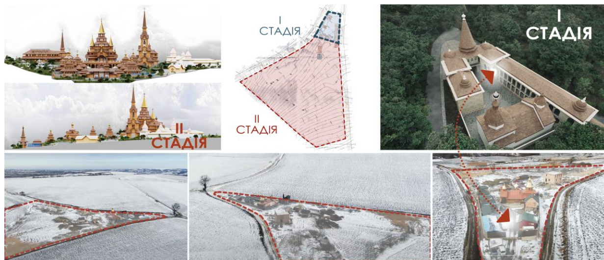
Рис. 1. Проект монастирського комплексу в умовах реконструкції існуючого скиту Похвали Пресвятої Богородиці, с. Великий Кучурів. 2019 р [17].

Великий Кучурів – село Великокучурівської сільської територіальної громади Чернівецького району Чернівецької області. Має вигідне розташування, за рахунок розміщення всього в семи кілометрах від міста Чернівці, наявності залізничної станції, декількох важливих автомобільних доріг українського значення, та залізничне сполучення з Румунією, що сприяє розвитку та доступності, зокрема, розвитку сакрального туризму.