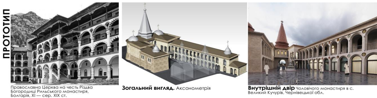
Рис. 4. Архітектурно-просторове рішення простору внутрішнього двору об'єкту

Серед реалізованих прикладів сакральних комплексів можна відзначити греко-католицький Марійський духовний центр «Зарваниця», в якому створено «Український Єрусалим» – архітектурні копії християнських святинь з життя Ісуса Христа. Комплекс будували близько чотирьох років, він вміщує у свою структуру всі священні пам'ятки на шляху Ісуса Христа та наочно демонструє Станції на шляху до розп'яття, сходи покаяння, гора Голгофа із трьома хрестами, Гетсиманський сад, копія Гробу Господнього та ін. В комплексі використовується облицювання з натурального каменю, мощення з грубою фактурою, відповідне озеленення а також рослинні композиції [18] (рис. 5).