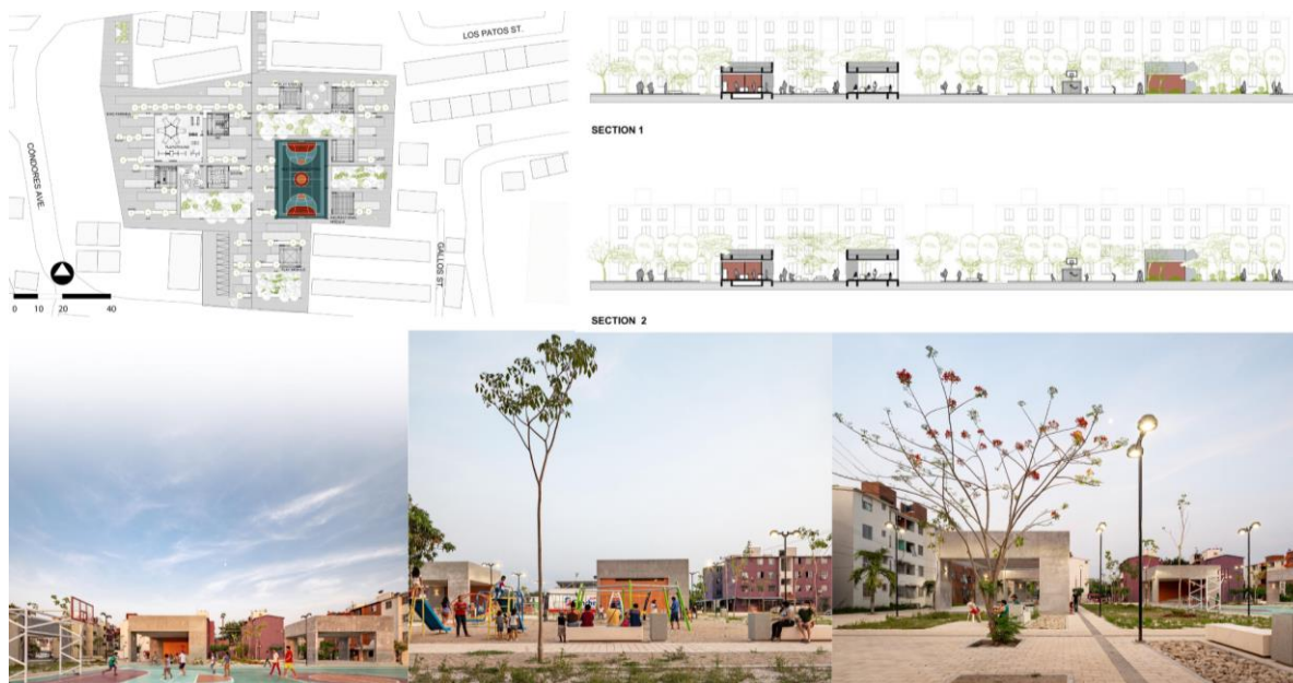
Рис. 4. Парк «Unidad Infonavit», арх. бюро Eréndira Tranquilino, Quintanilla Arquitectos, Табаско, Мексика, 2022 рік

Малий острів – це плавучий парк на річці Гудзон [7] (рис. 5), який виступає унікальним урбаністичним простором. Його конструкція тримається на 280 залізобетонних палях заввишки від 4,5 до 18 метрів, закріплених у дні Гудзона на залишках дерев'яного фундаменту колишнього пірсу №54. Верхня платформа парку складається зі 132 бетонних елементів у формі чаш-тюльпанів. Вони мають широкі вінчики й тонкі ніжки, які підтримують різнорівневі ділянки з ґрунтом, газонами та деревами. Завдяки варіативності висоти й форми чаш створюється хвилястий ландшафт, що нагадує лист, який пливе водою.