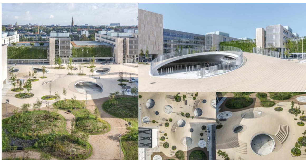
Рис. 8. Площа Карен Бліксен, арх. бюро Sobe, Копенгаген, Данія, 2019 рік

Площа Карен Бліксен є прикладом сучасного громадського простору, що поєднує екологічні та соціальні функції (рис. 8). Площа понад 20 000 м 2 є однією з найбільших у Копенгагені, вона розташована між новозбудованим корпусом Копенгагенського університету та природним заповідником Амагер, що робить її гібридним простором – одночасно парком і площею. Архітектурний ландшафт має характерні хвилясті пагорби, облаштовані для руху велосипедистів, та клумби з рослинами. Простір також передбачає місце для понад 2 000 велосипедів, з яких дві третини розміщені у критих зонах всередині пагорбів. Завдяки продуманому дизайну Karen Vlixbens Plads об'єднує потреби університету в громадських просторах і велопарковках із ландшафтними особливостями сусідньої спільноти [10]. Цей простір сприяє сталому розвитку, підтримуючи екологічний транспорт, адаптацію до кліматичних змін та біорізноманіття. Інтеграція велосипедної інфраструктури й зелених насаджень не лише зменшує вуглецевий слід, але й підвищує стійкість до змін клімату та сприяє комфортній взаємодії мешканців.