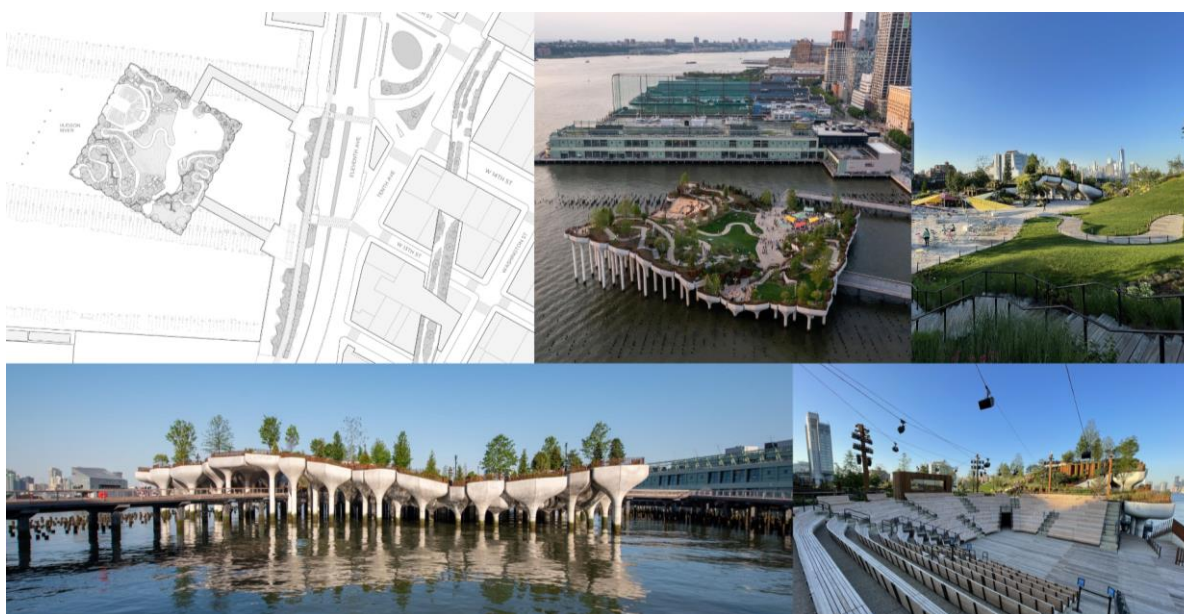
Рис. 5. Малий острів, арх. бюро Heatherwick Studio, США, Нью-Йорк, 2021 рік

Топографію парку доповнюють металеві шпунти та природні валуни. Рельєф дозволяє відвідувачам переміщатися на різних рівнях, звідки відкриваються мальовничі краєвиди. Перепади висот також сприяють створенню мікрокліматів, що забезпечують сприятливі умови для зростання рослин. Крім того, у парку облаштований амфітеатр на 700 місць для проведення концертів та інших заходів, сцена якого спрямована до води. Інфраструктуру доповнює фудкорт, що робить парк зручним місцем для культурного відпочинку й дозвілля.