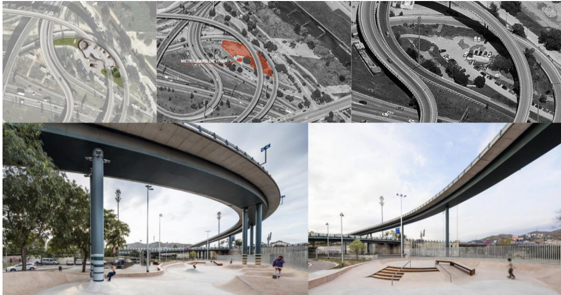
Рис. 6. Скейтпарк Baró de Viver, арх.бюро SCOV, Барселона, Іспанія, 2016 рік

Скейтпарк Baró de Viver (рис. 6) є прикладом інтеграції спортивної інфраструктури в міське середовище, який розташований у межах автомобільної розв'язки Трінатат, поруч із річкою Бесос у районі Сант-Андреу в Барселоні. Цей район характеризується складною інфраструктурою: численні транспортні маршрути та різнорівневі комунікації ускладнюють доступ до зони, що довгий час робило її недоступною для перехожих. Раніше територія переважно використовувалася як транзитна зона, оснащена підземними переходами для доступу до транспортних станцій [8]. У рамках проекту було проведено перепланування під'їзних шляхів із метою впорядкування стихійного паркування та покращення міського освітлення. Також прилеглі території адаптували для створення невеликих міських городів, що сприяло формуванню соціальної взаємодії між мешканцями та відвідувачами.