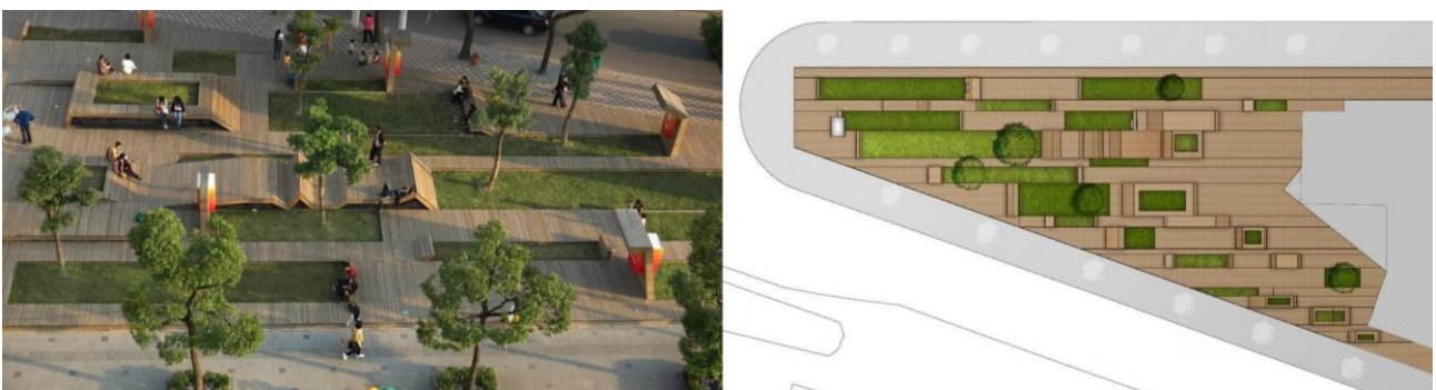
Рис. 3. Кіс Park, арх. бюро 3GATTI, Шанхай, Китай, 2009 рік

Ще одним прикладом є парк «Unidad Infonavit» [6], який забезпечує соціальне житло та його територію спільними громадськими просторами та програмами, яких немає в особистому масштабі (рис. 4). З глобальної точки зору, проект пропонує стратегію дизайну для покращення та активації соціальних житлових одиниць, щоб уникнути соціальних конфліктів і викидів вуглецю, спричинених знесенням. Оскільки соціальне житло в усьому світі стигматизується як джерело конфліктів і маргіналізації через відсутність обслуговування та погіршення соціальної та міської тканини, проект спрямований на дизайн громадських просторів у житлових одиницях як цінного каталізатора у великій кількості.