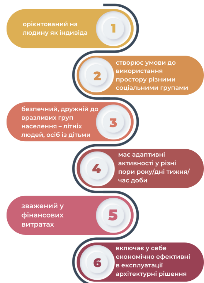
Рис. 1. Ознаки успішного громадського простору (Розроблено К. В. Курілович)

Озеленення грає важливу роль у формуванні громадських просторів (рис. 2), воно не лише додає естетичної привабливості та життєвості місцевості, а й покращує якість повітря, зменшує температуру, оптимізує водостік і знижує рівень затвердіння ґрунту. Зелені насадження виконують важливі екосистемні функції, як очищення повітря та поглинання вуглекислого газу, що є особливо актуальним в умовах забрудненого середовища міст.