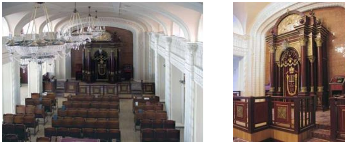
Рис. 2. Інтер'єри Львівської синагоги [2, 11]