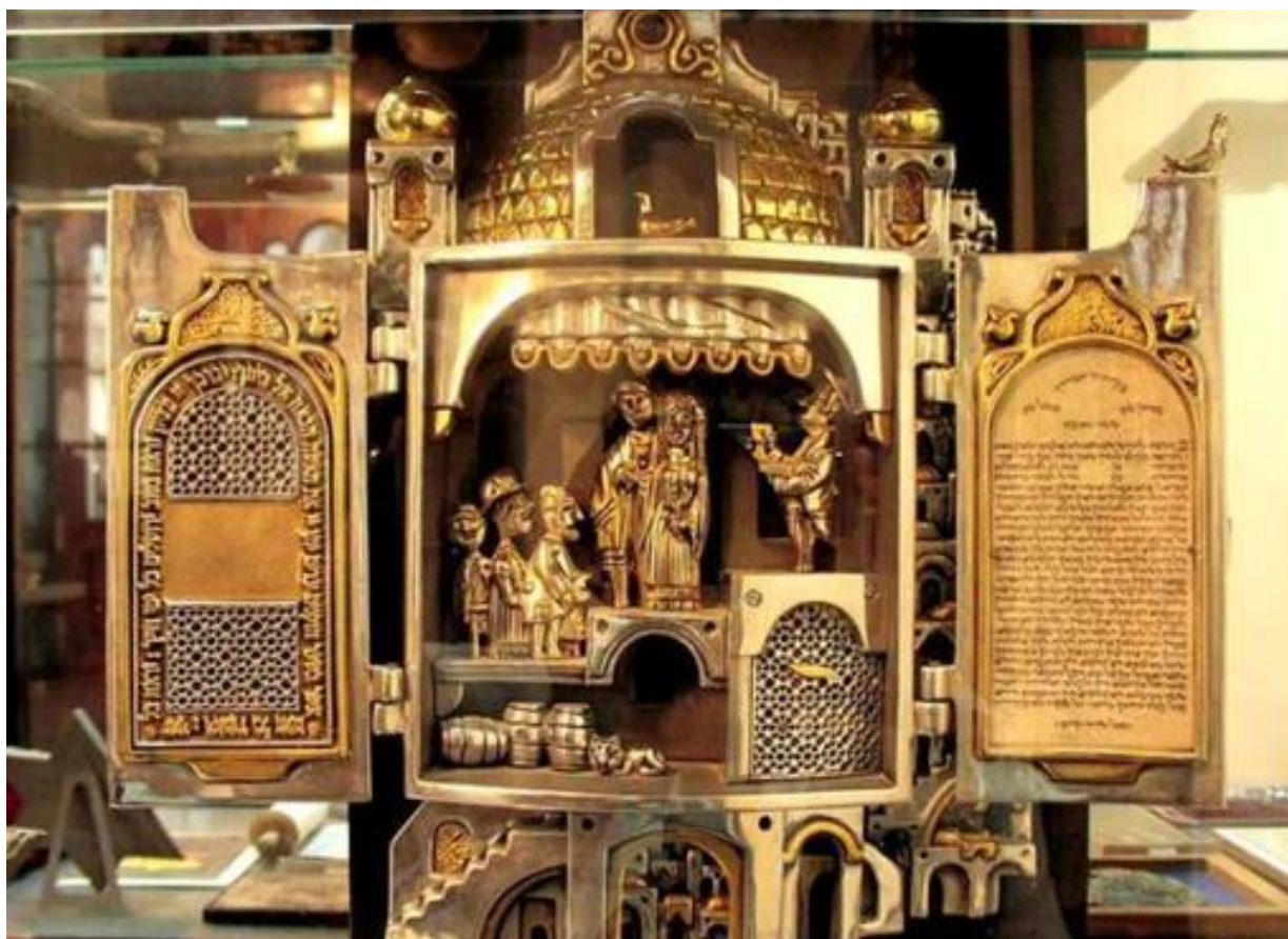
Рис. 3. Інтер'єри Львівської синагоги [2, 11]