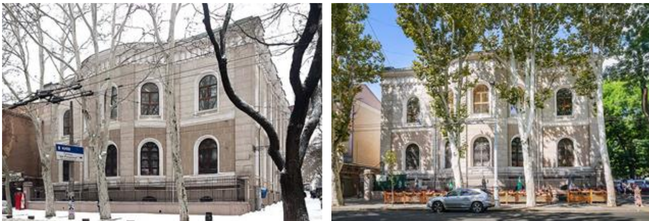
Рис. 4. Екстер'єрне зображення синагоги по вул Рішельєвській, Одеса [5, 12]

літературу, живопис, туризм та інші напрямки розвитку культури наших міст. В Одесі, наприклад відомо понад 50 історичних будівель, пам'яток архітектури будівель синагог, з яких зберегли свою функцію лише два об'єкти (синагога по вул Рішельєвській та вул Вадима Корженка (в минулому Осипова (рис.4, 5)).