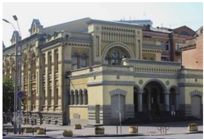
Рис. 1. Синагога в Києві: Реставрація синагоги Бродського [2, 10]

Приклади успішних проєктів - Синагога в Києві: Реставрація синагоги Бродського містить у собі не тільки відновлення архітектурних елементів, а й створення культурного центру, що демонструє інтеграцію традицій із сучасними потребами (рис. 1).