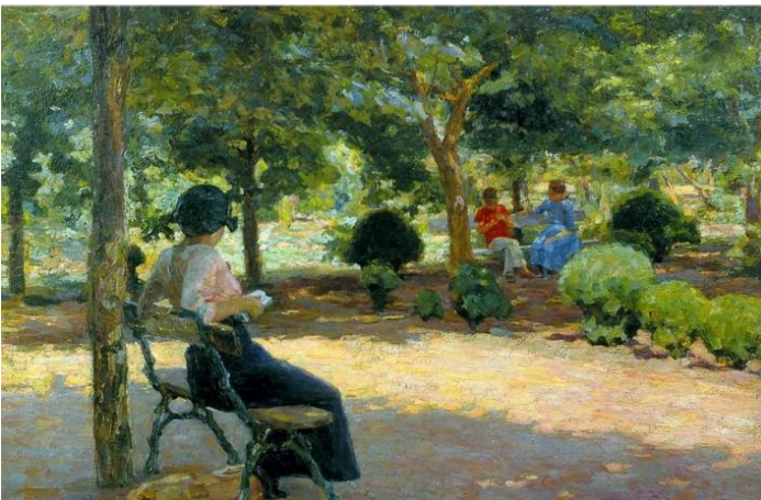
Рис. 3. Картина. К. Костанді «Сонячний день», 1910 р.

Традиційними залишаються педагогічні прийоми, які використовує викладач під час занять. Викладач сам є практикуючим художником, майстром своєї справи і може двома-трьома мазками поправити та «оживити» навчальну роботу, це може коштувати безліч довгих пояснень. Збережено роботу з натурою, без якої навряд чи можна освоїти складне ремесло художника. Обов'язковими, як і заведено, в одеській школі є роботи на пленері [10]. Одеським художникам притаманний величезний інтерес до пейзажу та вірність природі. Значний вплив має характер Одеського берегового ландшафту з особливостями освітлення та кольору. Завдяки пленеру та захопленню імпресіонізмом, живописці Одеси прагнуть передачі світла, простору та чистоти кольору. Деяка незавершеність робіт надає їм свіжість, легкість і безпосередність сприйняття, ніби глядач на власні очі побачив той чи інший куточок природи і зберіг його швидкоплинний образ у пам'яті. Робота на пленері, де освітлення змінюється щохвилини, передбачає етюдну форму (Рис. 3, 4).