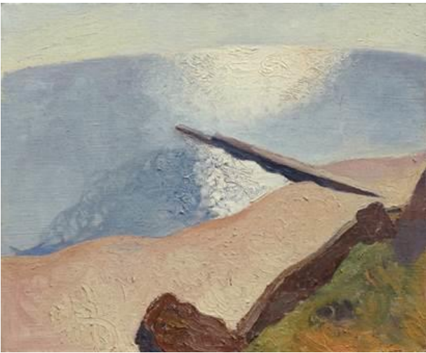
Рис. 1. «Чорне море.Одеса», Ю.Єгорова.1990 р.