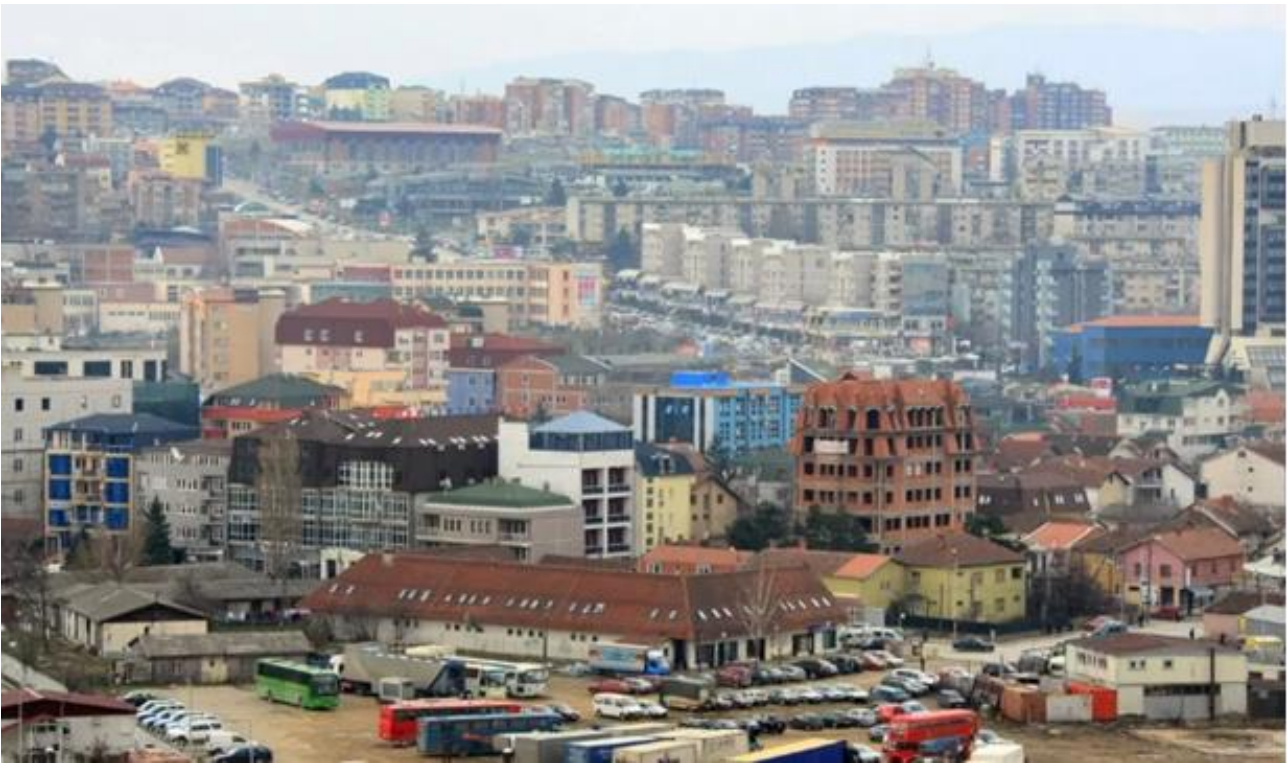
Рис. 4. Наслідки хаотичної забудови міста Приштина

Подібні проблеми проглядались на всьому балканському регіоні, Наприклад: Хорватія: У 90-х роках, через війну за незалежність і розпад Югославії, сільські жителі переселялися в міста у пошуках безпеки та роботи, що призвело до зростання міських територій, де відсутня необхідна інфраструктура, через що з'явилися хаотичні забудови.