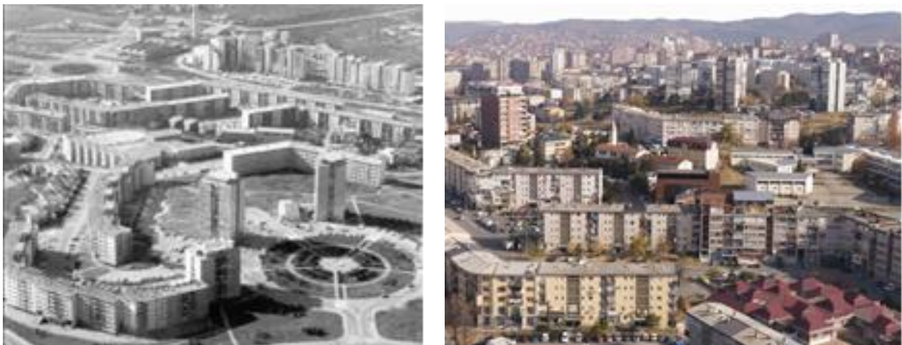
Рис. 2. Ульпіан у 1960 та у наші часи

Модерністські райони побудовані за часів радянського періоду такі як Ульпіана, що включають багатопверхові житлові комплекси (Рис. 2). Адміністративні будівлі, збудовані у 1960–1980-х роках. Сучасні райони, де активно ведеться будівництво нових житлових та комерційних об'єктів, що пов'язано зі зростаючою економікою та необхідністю оновлення міського середовища. Приштина є не лише політичним, а й культурним та економічним центром Косова. Тут зосереджено урядові установи, університети, культурні центри та міжнародні організації. Місто переживає швидке зростання населення та розширення інфраструктури, яке після завершення війни 1999 року пережило значний урбаністичний бум. Попри залучення міжнародних організацій та їхню участь у відбудові міста, питання неформальної урбанізації залишається актуальним.