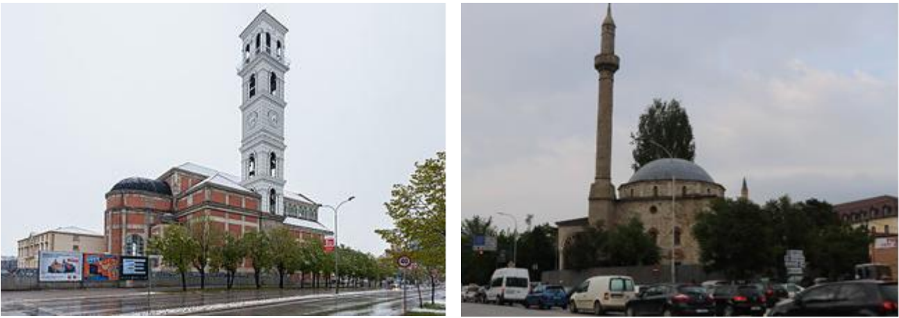
Рис. 1. Годинникова вежа та мечеть Фатіха Чаршия

Модерністські райони побудовані за часів радянського періоду такі як Ульпіана, що включають багатопверхові житлові комплекси (Рис. 2). Адміністративні будівлі, збудовані у 1960–1980-х роках. Сучасні райони, де активно ведеться будівництво нових житлових та комерційних об'єктів, що пов'язано зі зростаючою економікою та необхідністю оновлення міського середовища. Приштина є не лише політичним, а й культурним та економічним центром Косова. Тут зосереджено урядові установи, університети, культурні центри та міжнародні організації. Місто переживає швидке зростання населення та розширення інфраструктури, яке після завершення війни 1999 року пережило значний урбаністичний бум. Попри залучення міжнародних організацій та їхню участь у відбудові міста, питання неформальної урбанізації залишається актуальним.