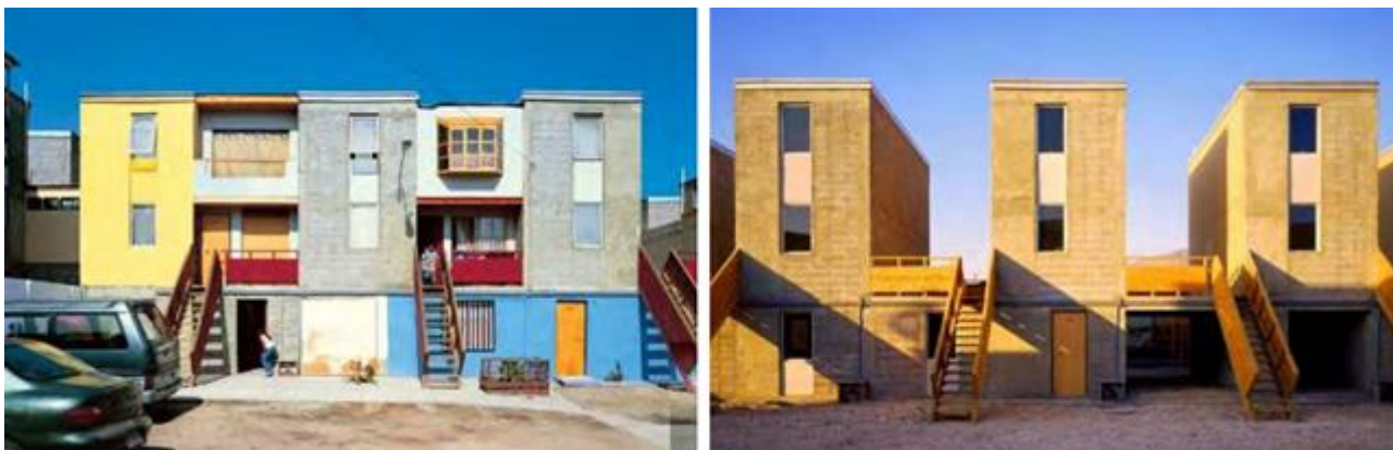
Рис. 5. Приклад покращення неформальної забудови міста Приштина

Інші міжнародні фонди та ініціативи зосередили свою увагу на допомозі у створенні місцевих, громадських організацій та архітектурних асоціацій. Поступово, рух у напрямку інтеграції активного міського суспільства у роботу міських адміністрацій, призвів до більш ефективної та злагодженої роботи в питаннях формування гарного міста.